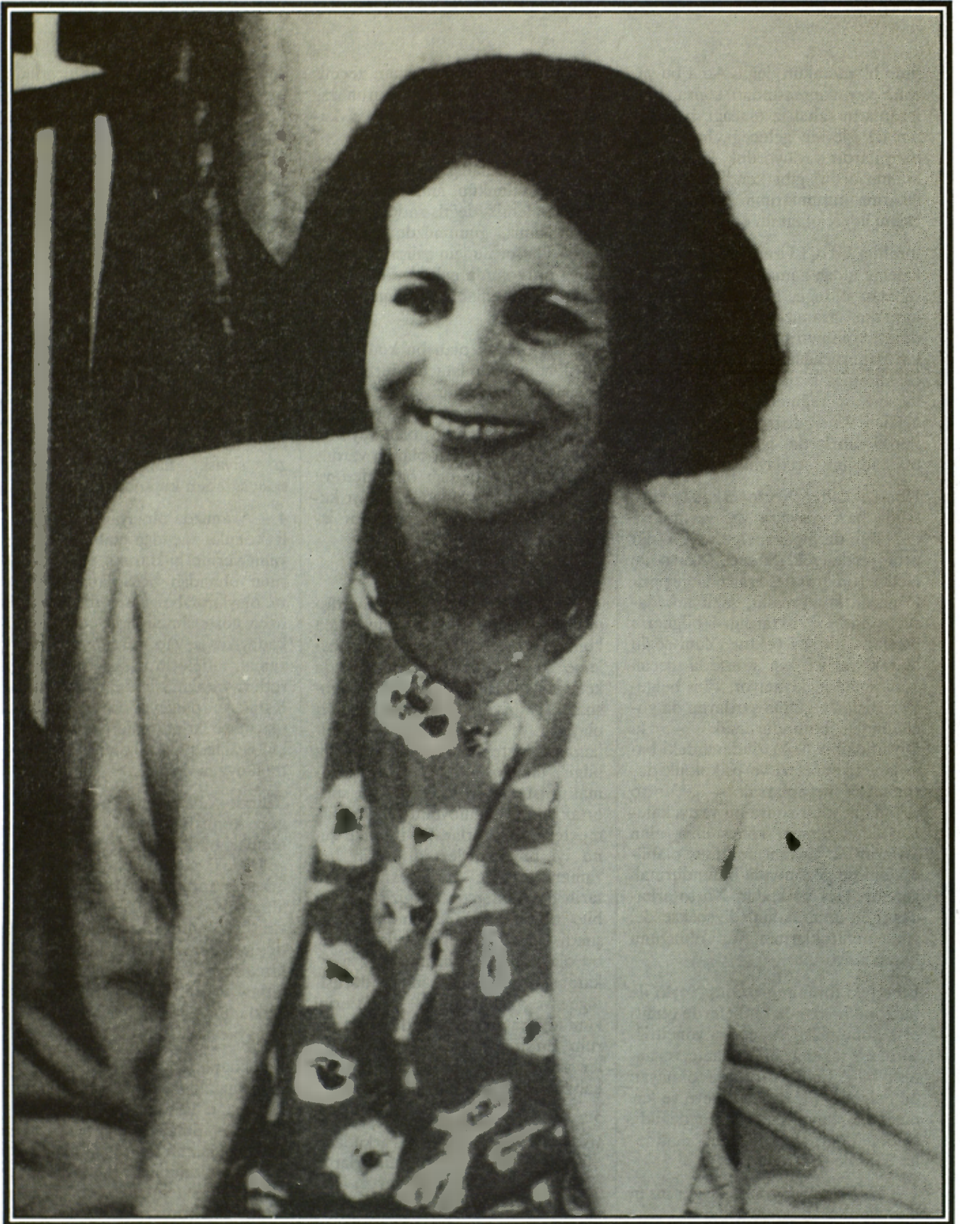
Effet Qazî, jina kurd ya hêja bi destê Iranê ve hat kuştin!

Yekîtiya Sosyalîst Rizgarî • Demokrasi • Sosyalizm