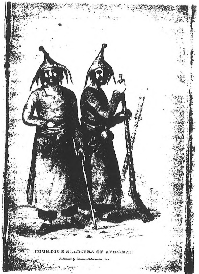
1830, serbazên Kurd li Avroman