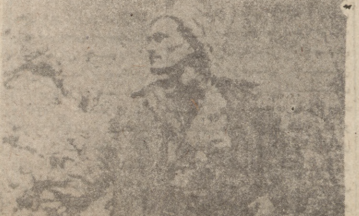
سوزشگرانه و دیوگراسی یانه دا

له نوینترانی ولاته بی لایه نه کانیش له وناری خوزان دا نو اورسته یان سه لایو کو تیان که به لایه یی به رمانا به نه له نیشوان دور و دوه و کانی جهانی دا بو لایه یی ، به لایه یی نیمه به رمانا به به لاشستی جهانی دیغا بکه یی له ده زی دمه ست کردنی گهلان نیمه یالیزم میساری گهلان نی بکتوشین . له کانی نه وانه ده به سه که خوزش له گوندی دیوان له