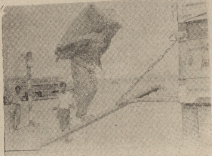
ره نه بهرى كوردستان بهم جۆره نان په یدا نه كەن ديسان له ووی زانستی به وه زووداویكى ئاساییه ئه مپیش