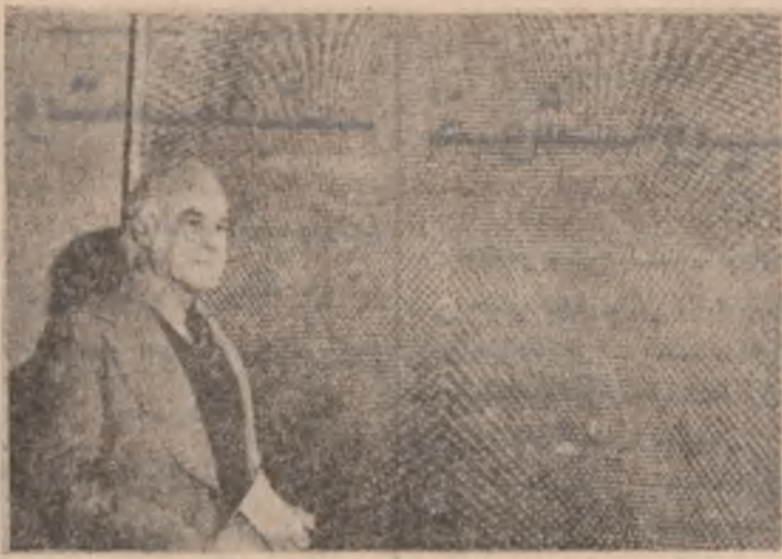
صلاح طاهر له بورد هدى ويته ڪي زهاري دا