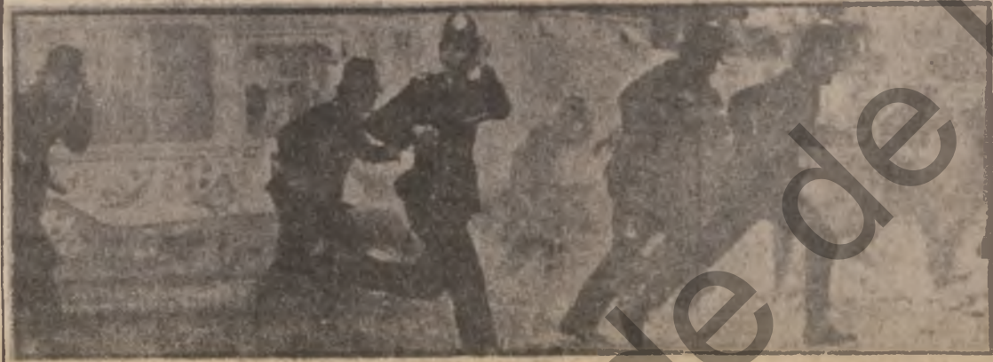
بولسی بهرتانیایی دوو میلیون کس دم کوت ده کات

دوه تان ده کړد . . . دویباری نه فریقا له سالی ۱۹۴۸ دوه نویتری جزیه فرمانروایه که لایه کسری تازه کان یون له کانی شمری دووه مینتی جیهاندا به یوه نندی نیوان خواروی به لایانگری دیموکراتی ویه کسکی دایتریز . . .