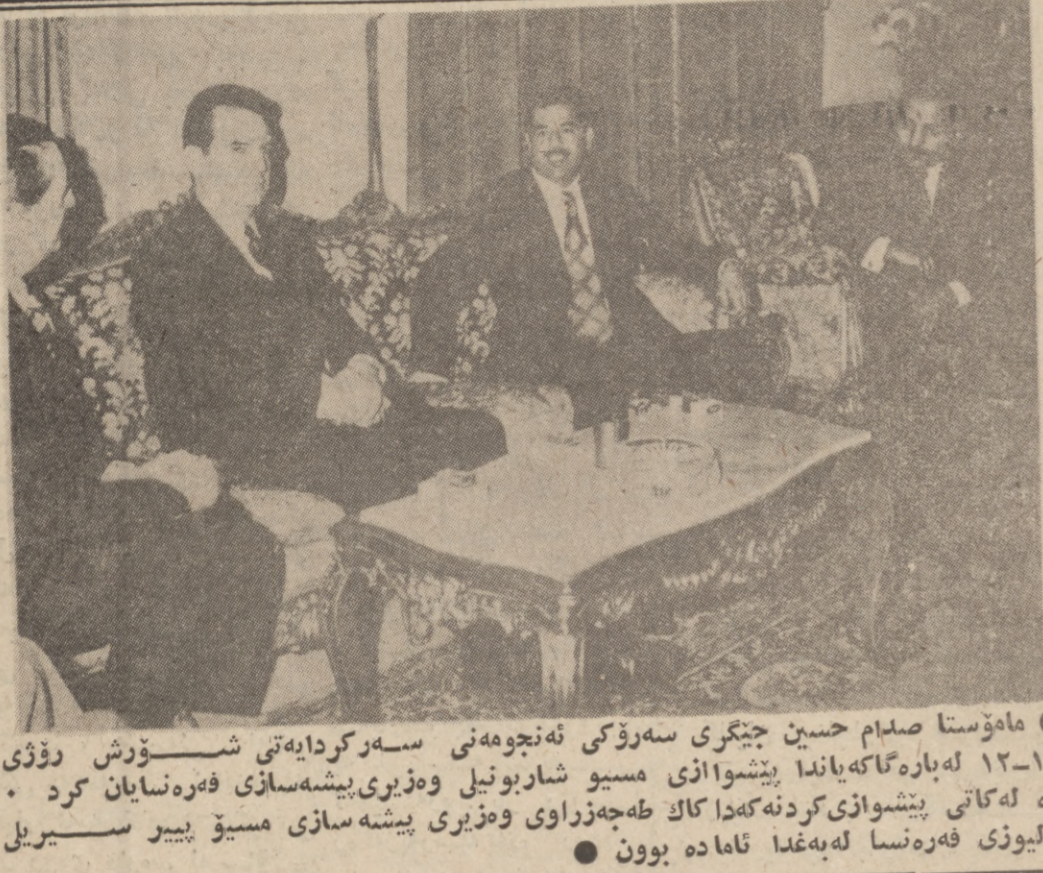
ماموستا صدام حسین چیکری سهرؤکی نه چومنه ی سهرگردایه تی شوروش روژی ۱۹-۱۲ له باره گه کایانده ی مسمو شاربوتیل وهزیری پشکسه سازی فهره نیان کړد . له کانی پشکوه ی کړدنه کده کاک طه چه زراوی وهزیری پشکسه سازی مسمو پییر سیریل بالیوزی فهره نسا له به غدا نامه بوون .

بیرتی نهوت له نه مهربکاوه له نده کاریکتی راست بوو ، هه رجه ندهش به لای نیمه و له اوژو و وه له و راهه یانه بوو که نه مهربکا ته نکاو بکات رده ست له پشکری کړدن دوژمن هه لگرتی ۰۰۰۰ به لام سیاستی که م کړد نهوتی په عهره ی نهوت به کشتی زبانی زیاتر به دهوله تانی تر کایانده کله که نه مهربکاوه نه چامه کشی به پیچخواوی نهو مه به سترانه هانه پشکوه کسه له پیناویا کرا . که م کړد نهوتی بهره می نهوت بهو جوری کونه به سترانه عهره ریکیان خست ولاتانی نهو روپا ژاویزیم نه خاته تنگو چه له مبه ی ناپوری بهوه . نیچر ماموستا صدام وتی هه موو به لگسه سیاسی نابوری به کانی و له گه به یان که له نه چامه نه مهربکا سود له م سیاستی ته و نه کړت . وه دهر پاروی زیاد کړدن ترخې نهوت وتی نه مهربکاوه ترخې نهوت بهو شپوه کومپانیا سهر به خوکانی نهو روپا ژاویزیم بهه به سترانه مو نوپولی نهوتی جیهان لاواژ نه کات . وه « ریگای راست یو به کارهیتانی نهوت وه که چه کیک ، میلی کړدن به شنه نهوتی نه مهربکاوه دهوله تانی سهر به دوژمنه . . . که ثم میلی کړدنه سهر به خوکانی نابوری بهدی نه هیتنی و ریگای نهومان نه خاته پش که سامانی خومان بکوه و پش دهست خومان و به سهر به ستمی مامه له له گهل ولاتانی دنیا دا بکه ین . . .