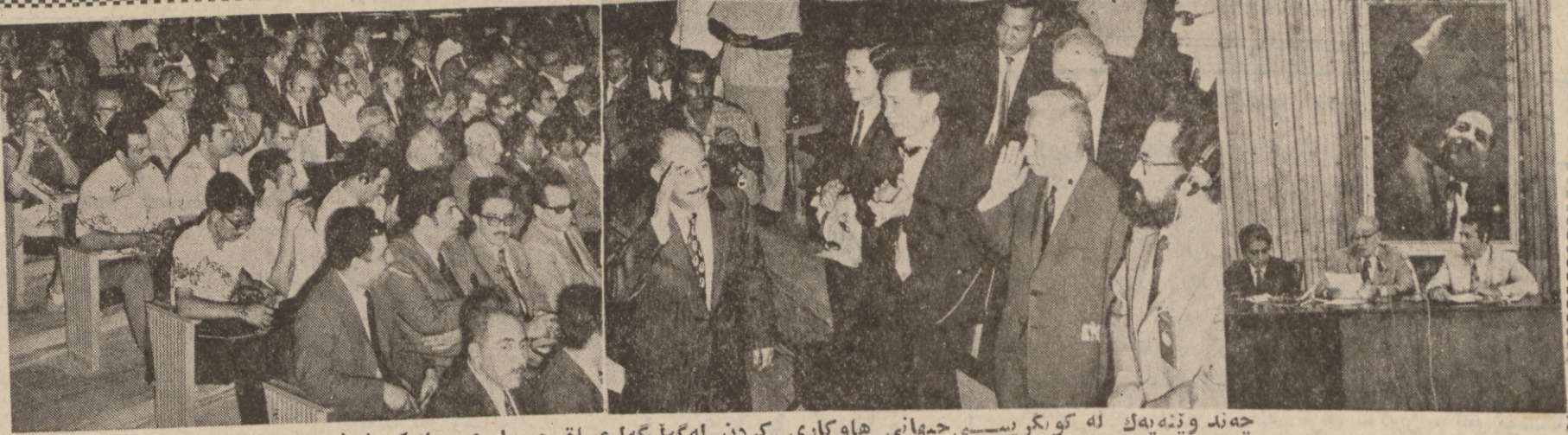
چهند وێنه بهك له كونكریسی جیهانی هاوکاری كردن له گهله گهله عیراق دهربارهی میلی کردنی نەتو .