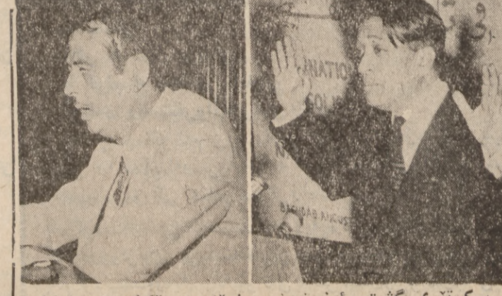
سکر تیری گهشتی نه ججه مانی نوینه ری ریکراوی هاو کاری ئاشتی جیهانی میانه تانی ئاسیا و نه وه ریکا