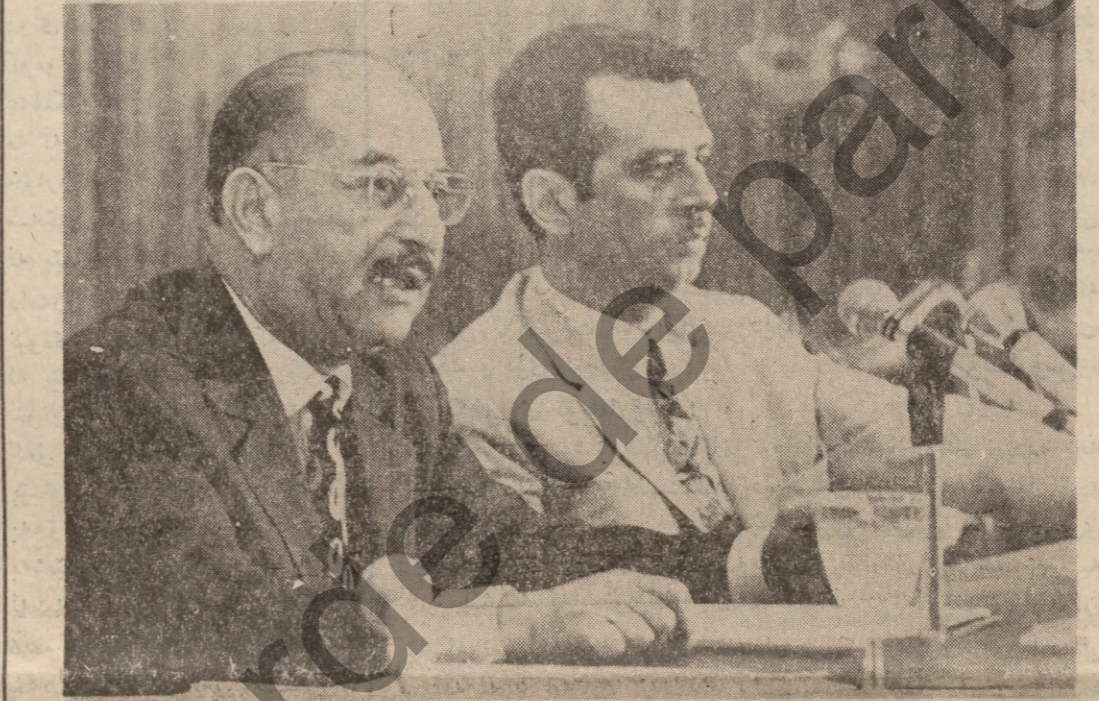
به سه ره ره رستی سه ره ک کۆمار کاخ احمد حسن بئکر رۆژی بیئج شه مه ی رابوردو کۆنگریسی جیهانی هاوکاری کردن له گه ل که لی عیراقدا دهر باره ی میلی کردنی نه وت گه ره وه ، هم کونگریسه له لایه ن ته وجمه نی ناشتی دنیای ریکخراوی هاوکاری میله تانی نه فه رقاو ناسیا و ته وجمه نی نیشمانی ناشتی و هاوکاری کۆمه رانی عیراق ریکخرا .

کۆنگریسی جیهانی هاوکاری کسردن له گه ل که لی عیراقدا دهر باره ی میلی کردنی نه وت .