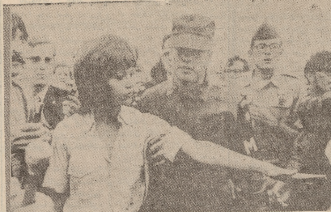
جين فوندا بهرزه هوى بروايه كى قايسهوه نه چيت بهر كى تاوانه كاني زيمي ...