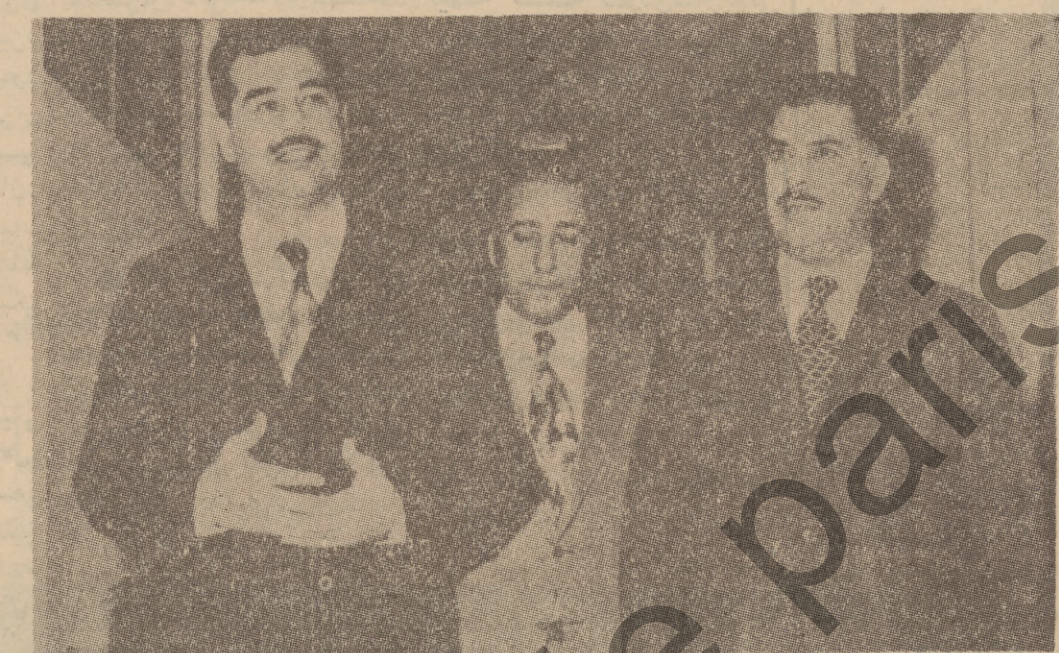
روژى ۸-۶ ماهوستا صدام حسين جن گرى سه ره وى ئه نجه مئى سه ركردايه تى شورش سه رى له واره تى راكه باندا وه لوى له لايه ن وه زيرى راكه باندا و به ربه وه به رى مه كته به ي راكه باندى نه وه به و نه قه يى روژنامه نووسان و فه رمانه وه كار به ده ستانى وه زاره ته كه وه پيشوازي كرا ئه نجه ماوه صدام سه ره ي له به شه سه كانى وه زاره ته كه داو و تازيكي خوينده وه تيايدا وتى :

سنا : ۸-۸ نا.د.ع : بيار وايه به م زوا مه شيخ عبدالله احمد سه ره وى نه نجه مئى شورى به مئى ژوروو به سه ره دانتيكى رسه ي بچه بۆ چين .