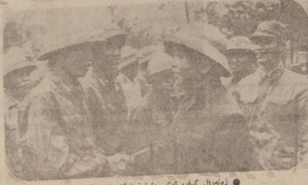
ژنه رال غیب له گهل شوپشکیرانی

سدهان ساله نه فیهرقا له زیز باری گرانی کولونیالیسته نه نالیست ، وه سه خستری شویوه چه وسانده وه و ژورلی کردن و مال ویرانی به ده ست داگیر کرا نه وه نه چیت . چونکه نه فیهرقا وه کو که نه چینه یی خیر و بهر کهت وایو بره له جوره ها که ره سه یی پیوستی ناتون و بورانیوم و معده نی تری به نرخ ، بؤیه ده ولته نیمیر له لیسته کانی روزوا له ده میکه وه چاویان تیر یوه و هتا نیست د ژماره کی ژور له گهلانی نه فیهرقا دوچار یی سیاسی روژی رزگاریان تهواو بزک