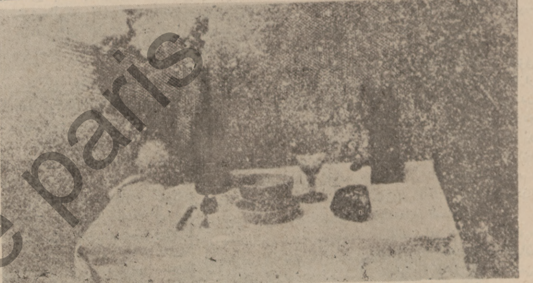
یه که م وینه که له جیهاندا گه روه و گرتی هه شه ست سه مانی ته وای خایانه ره