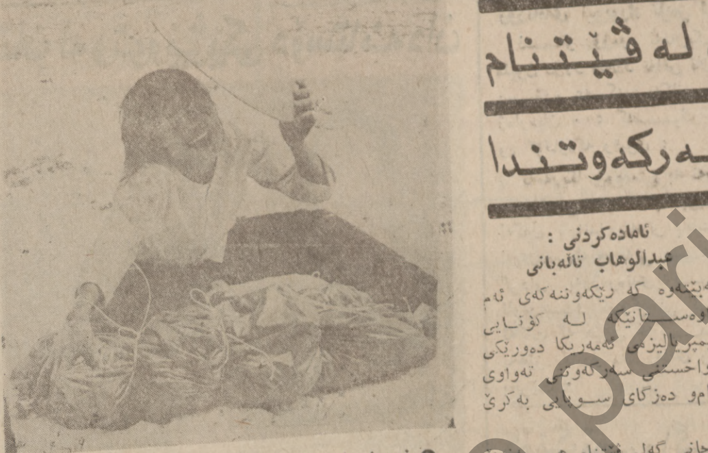
نهوونه یی ک شارسنا نیستی نه مریکا له فیتنهام

نهوونه یی ک شارسنا نیستی نه مریکا له فیتنهام ژبانی گهلانی هیندی چینه وه هه ییو سرکهوتنی تهواویش کانی وه ده ست نه م تیرئی که ههمو گهلانی ناوچه که ستر او تیریه تی شوپشکیرئی خویانان وه ده ست خستری ههمو کام و خط تاک کسان نیمیر یالیزمیان له ناوچه که دا تیک شکانان . بؤیه سر کهوتنه کی لانی سرکهوتنیکی وه خه یی سرکهوتنه به سهر ستراتیجی سوبایی نیمیر یالیزمدا . بهلام له هه مان کاند هان پین که یی کهلی مژنی ریسوایی سرکهوتنی تهواوی گهلانی هیندی چینه .