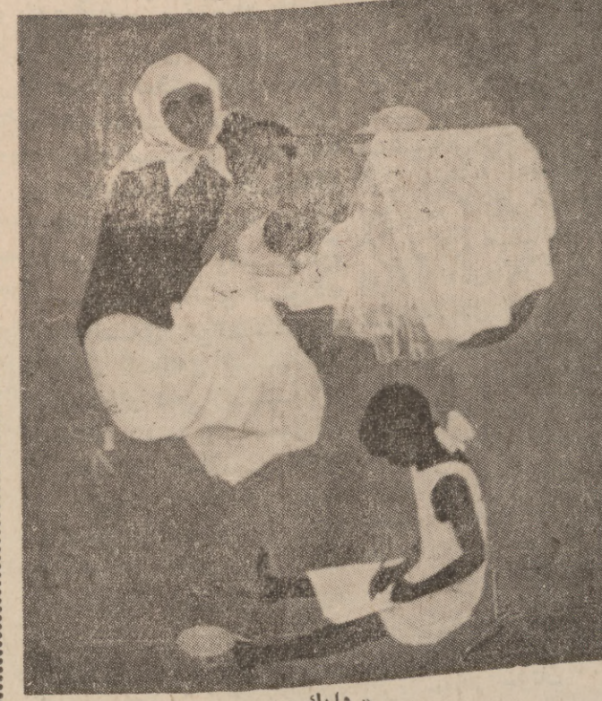
« دایک » ده ست کردی هونه رمانه ندی سو فیه تی « کوتیشیف » له قرگیزیای سو فیه تی .

● ئه نجه رید برجهان سه روکی میهره جانی ( کان ) ی سینه مای میهره جانی سینه مای له شاری - کان - له قه ره نسا ده ستی یی کرد نه گه ی جیهانی به ناو بانگ ئه نجه رید برجهان کرا به سه روکی میهره جانه که ، برجهان که ته مه نی ( ۵۶ ) ساله و خه لکی سویده ، وتویه تی له م ئه رکه ی بیه م سیه ر را وه زور ئه تر سه م به لام خۆشه و یستیم به رام به ر هونه ر ی سینه ما تر سه که ی له بی سه ره ک خۆی ته مه ن در یژ بیشت .