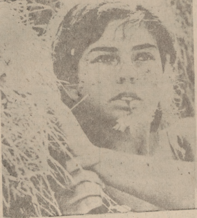
وینه بهک له فیلمی شه ورۆژ