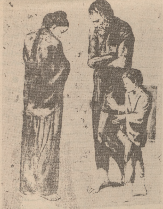
« هه ژاران له گه م هه ژار » ده ست کردی هو ئه رنه ندی نه مر « بیکاسۆ سالی ۱۹۰۲