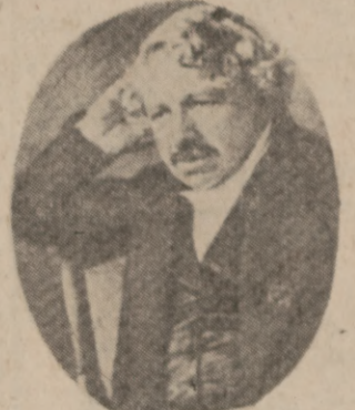
دۆماسی کیمیا زانیش له گه ل زنه که دا چه مانی کارا و به درزیای رۆژیک هه زووریکه تاریک دا له گه لیا مایه وه ، که هاته دهر وه ، زنه که ی ئینی برسی

● نه یه و ئی بگاته نه وه ی نتوانی وینه ی خه لکی بگرتی !!