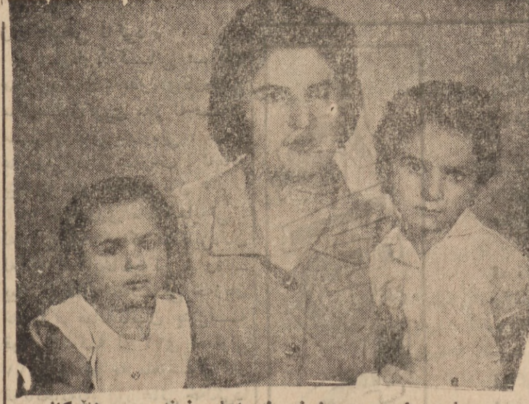
هاوسری حسنه زینک و قوآنجان زیندی و مثالہ گانی