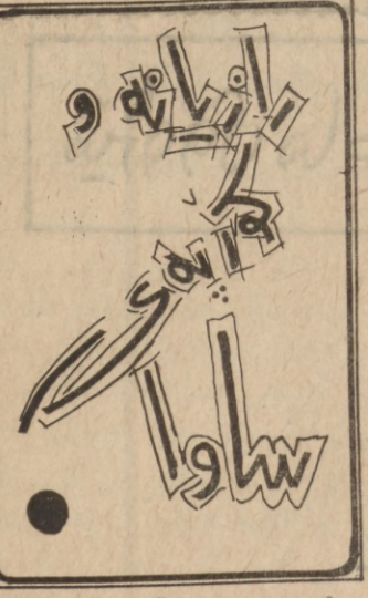
نهمه رسوول پستردی

رازبانه بهری گیبایه له کویستانه گان نه بیست ۰۰ چه ندین سنال له موبه بر له کونده گان و ناوچی بشار به کار ده هتیرا بؤ خوزاکی کوز به ی ساوا نهو کوزرانه ی که هیشتا نه که وتونه گروگان و کاژولکو به نه چیه ی ناسکیان نه گرتوه به داری ( ره وره وه ) وه ۰۰ نهو دایگانه ی که شیریان کم بوه زیاتر به کاریان هتیراوه ۰۰ به دوو جزوی لیک جیاواز کراوه به دهمی نالی مثالوه ۰۰ جزوی به گه می بهم جه شنه بوه . « رازیانه و ورده شه کرو ورده نان و جاروباریش زیری خوزاکی تیکهل کراوه له ( دهرست ناوتگسا ) کورتراوه به شتیوی توزخراوه ته سهر زمانی مثالوه که ۰۰ جزوی دوه هیمیان به شتیویه کی نهو تژ کراوه که زبانی گهلک له سودی پتر بوه ۰۰ به لکو بؤ هژی نهوی کده و فوژک و روکولای نهم مناله بؤ ته هیلانه میکرپ ، تهن و خونی نهم مثاله ی داهتیاوه له بهل و بؤی خستوه و مایا بؤ ته هژی مرند و لسه ناوچی نه کوزر به که که نهمه شیان بهم جزوه بوبه « رازیانه و ورده شه کر له بهک دراوه دوا ی نهوه کورتراوه ۰۰ و وگراوه ناو لچیکتی ( سهر لانک ) وه یا پارچه به زپریه ک و به داری لانکه کدا شوژ کراوه توه به مریک که کوی رازیانه ورده شه کر که له ناو به روه به ستراوه کدا که گوی نهوی مایا که له کوره تریوه ۰۰ و مناله که له سهر پستی لانکه نهم به روه ی هژیوه که بیی دهلین « دمکوله » دوا ی نهوه ی که جباری به کم مثالوه که دهمی لسه دمکوله به به روه له بهر نهوی که به لیک دهمی مناله که تریوه وه به هژی ورده شه کر که بوه به شیلوه رازیانه ش خوی جوره ۰۰ بویه دیوانه که نهم دمکوله به به وگو بزمار رن کران له میشو و مگه ز دا شه لال دراوه بؤ جباری دوه هه مو سیه مو پرونانه ل ۷