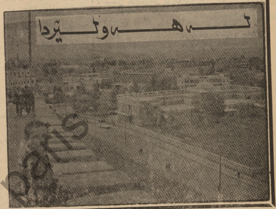
سهعات ٦١ سهر له بهیانی

پوڤونی کوردوه که پرتی دیموکراتی کوردستان و سویای شۆرشکرتی کوردستان « ٩ » سال له پیناوی بهدی عینسانی مافی گهلی کوردا سهدان شهیدای بهخشیوه ههزارهها کرێکارو جوتیارو کاست کاروه دیناوه کانی بیخانوو لانهو بیکار مانهوه . وه برای ناوبراو داواي له پارتی بهعسی عهزهبی نیشتراتی و پارتی دیموکراتی کوردستان کرد که ههموو له ناخو دلوه پشتیووانی بهیان نامه که ١١ ناڤار بین بۆ جیکر کردنی بهنده کانی . وه ووتی « زۆو منالی شههیده کانی کوردستان کرێکارانو جوتیاره زهره لێ کهوتوکان چاوه نواری ههمهتی مهردانهی ئێهون بۆ ئاوهدان کردنهوهی وولاتی ویزان کراو .