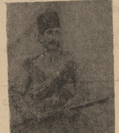
ستارخان دامه زور سهری حزبی شیوعی تیران ۱۹۲۰