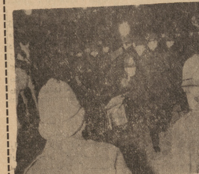
له لندون خویدا خویشاندان کراوه دوی نه و کوشناری له شاری له نده ندی کراوه ۱۳ کس تیا کوزراوه ۰

له لایه کی تریشه وه به ریتانیا که وتوه کومی خوینه وه به هوی باری نایرله ندا که کوشنار له نیوانی دانیشتونای نایرله ندی سهر ووه هیزه سهر بازی به کانی حکومتی به ریتانیا دا تایت بهر نه ستیښتیه وه به کوشنی ۱۳ کس له شاری له نده ندی به کوللی سهر بازیو به ریتانیا به کان هینده بتر گری کویره ی خسته م سله کوه ، حا ژمه برسار نه که یان نایا نه و جوړه رژیمانای وک به ریتانیا تا چه بفرگه ی نسهم ته نگرچه له م قورسانه نه گرن ؟