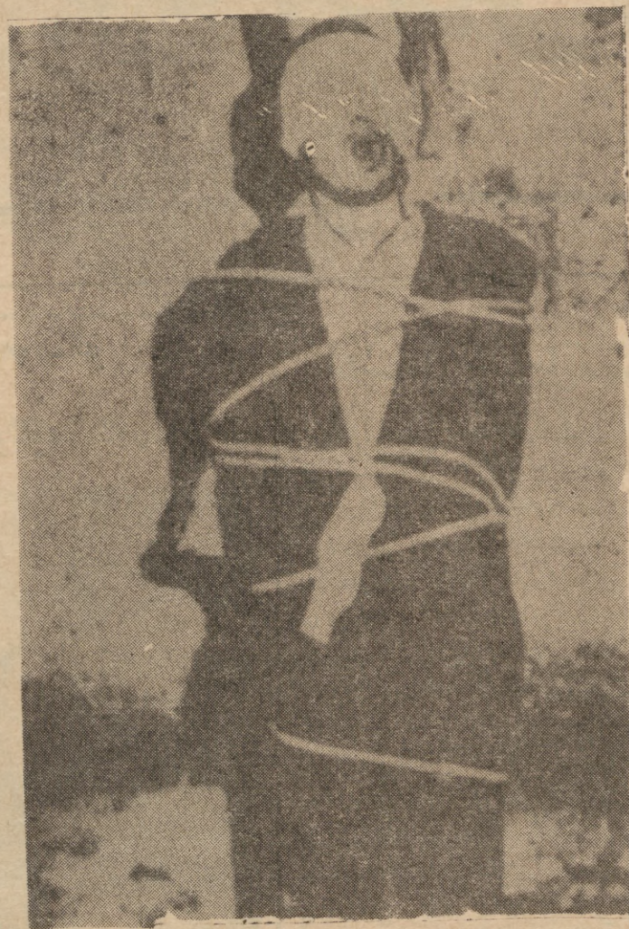
سهرانسری ټیران بگریتهوه ، اهرهوه ا سهرکرده کسانې بزوتنهوه که به به لیتنی قوام السلطنه خهله تانوه له

به ماوه به کی زو ژور بهی نوجه کان کهرته ژور دهستی لهشکری حوکمه تهوه ، وه هندیک له سهرکرده کانی فرقه ټیرانیان بهی هیشتهوه ، بزوتنهوهی نازدربایجان بهم جوزه دواى پشنتی کردنی ههزاران قوربانی دوچارى شکاندن بو .