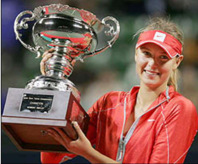
شارا بوفای جامی پاله وانيئ توکيو بوئيسی سه ر زوی به رزه کاته وه