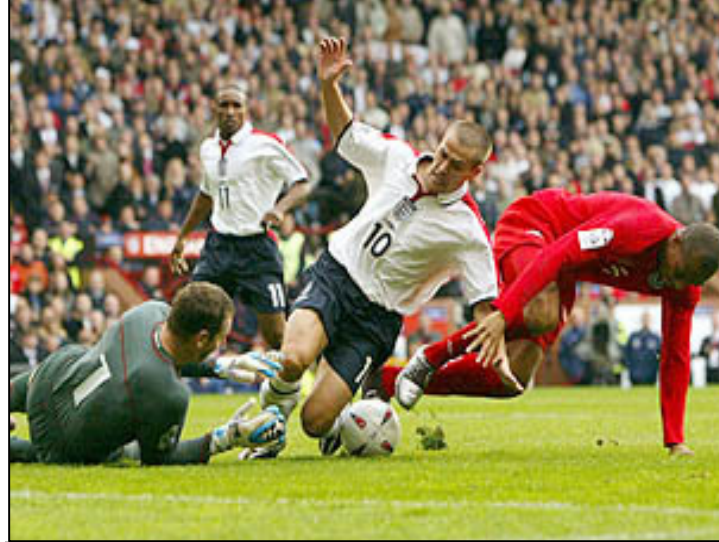
نؤلين (تووشی ليڈان ده بيت له هه و لي توهار کردنی گول له ويلز)