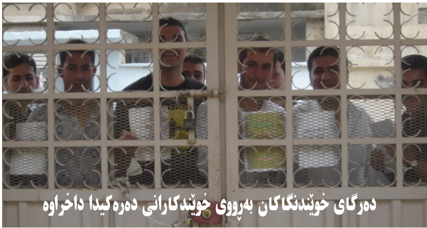
دەرگاى خوئىدنگاكان بەرووى خوئىدگارانى دەرەكيدا داخراوھ

تايبەت رۆز بەرۆز لە زيادبووندايە. مامۆستايانى ئامادەى بەر لە بىسمىللاى خوئىدنى ئەمسال، نرخی وانەى تايبەتو رۆشسوئىيان بەخوئىدنگارەكانيان وتسووھ، ئامۆزگارپىشان كىردون، كەپەلە بگەن ئەگىنا دەولەمەندەكان مامۆستا باشەكانى وھ ئىمە و مانان زوو دەگرن.