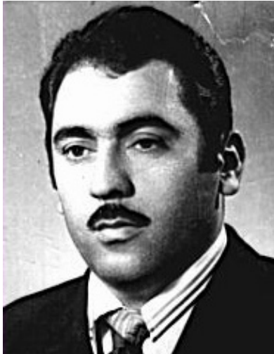
ماموستا "نه حمده سالج نه حمده" وهرزشکاریکي ديړينی سليمانی په و

سه ربه رشتياری تايبه تمه نندی وهرزشه له به ريوه به ريئتی چالاکي وهرزشو ديده وانی سه ر به په روه رده ی سليمانی، ئیستا جيگر سهرؤکی په کيتی ناوه نندی شمشيربازی عيراقه، له م مانگه دا وه که سهرؤکی شاندي شمشيربازی عيراق چووبق عه ممانی پايته ختی نه رده و له وئ به شداری له خولی کي راهينانی شمشيربازی کرد به هه ر سئ جوړه که يه وه (شيش، شمشيری عه ره بی، شمشيری موباره زه)، که به سه ربه رشتی (ميستر بؤب) سهرؤکی ليژنه ی هونه ری په کيتی موباره زه ی نيوده و له تی و دوو پسپوری بولغاری تر نه نجامدارا، شايه نی باسه خوله که به ناوی خولی (هاريکاری نؤلومپی موباره زه) بوو، که له روژی ۳-۲۰۰۴/۹/۱۶ ی خاياندا ماموستا (نه حمده سالج) يش، به بروانامه يه کی موباره زه ی نيوده و له تپه وه گرايه وه بق کوردستان، به ناوی لاپه ره ی وهرزشه و پيروزيایي ليته که ين.