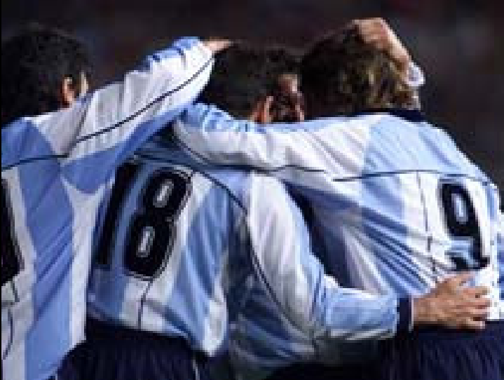
برده ووی نه رجه نين له نؤروگای (۴) گول به رامبه ر (۲) گول