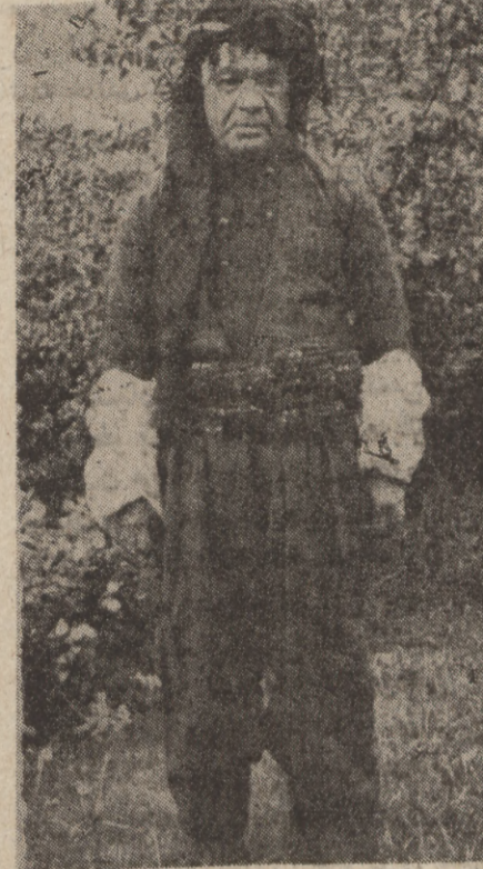
لیکولینه و ورپینرتاج

تیر با به سندی بدینه عه ره بی با ( مضاف و مضاف الیه ) دانه یوزین ، جا که نه واره و اتاو قه واری ( گواسته وه نامه ) به سهر ده می کور دانه نه بوون نهو قه واری نه وراسته ، نه مه وک نهوه وانه که نا بی به ( ناو ) بلتین ( ناو چونه که عه رب بی ده نیتین ( ماء ) نه که شتیکی با شتری شک بر دووه بۆ نهی نووسیه و بیان ووشه ( وورد یار ) له رووی اشتقاق وه وک ( کور یاره ) ( نووسر ) نه دیب ده ترینه و نه نه که نه رمان و تابه ( نارد یاره ) = مدقق ) تیشه که مان . وه له و حله که نووسر خۆ به ستنه وه ده بوو چونه که عه رب به ( نارد ) ده لیتین . بۆ نه دیب دانرا ، بیر له کانبو ( دقتی ) ! عه ره و حله نه کرا وه ته وه ، عه ره ده نیت ووشه ی ( دووبات ) بۆ ( تاکید ) ی تیشتا نه مان بشی با شتر عه ره بی ره وانی به چونه که شتی واره یه سه ده جار ده ووتی به بی یان بی برا .