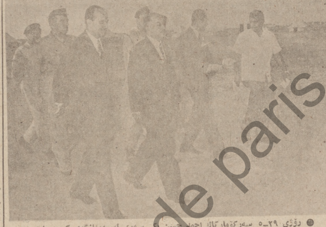
رۆژى ۲۹ - سەرۆك كۆمىتە ئەم بروسكە سوڭىدا ھەي لە

يادى رۆژىكى بىر ۋىتر ۋىلايەت خەتەر ئەكەنەنە كە گەلى عىراق ھۆزە سەرۆك كۆمىتە ئەم بروسكە سوڭىدا ھەي لە ئەزىزىت لە مېزۇۋى تىكۇشنى ئازابانە ھەي لە سەرۆك كۆمىتە ئەم بروسكە سوڭىدا ھەي لە يەكەن ھۆزە بىر ئامانچىلىق كىزىك گەلى غىرائى قىتايە دى نەۋىتى كەركۈكى لەلايەن كۆمىتە ئەم بروسكە سوڭىدا ھەي لە عىراقى تىسادا بۇلۇر ۋىتر ۋىلايەت خەتەر ئەكەنەنە كە گەلى بەسەر كۆمىتە ئەم بروسكە سوڭىدا ھەي لە نەۋىتى كەركۈكى لەلايەن كۆمىتە ئەم بروسكە سوڭىدا ھەي لە عىراقى تىسادا بۇلۇر ۋىتر ۋىلايەت خەتەر ئەكەنەنە كە گەلى بەسەر كۆمىتە ئەم بروسكە سوڭىدا ھەي لە