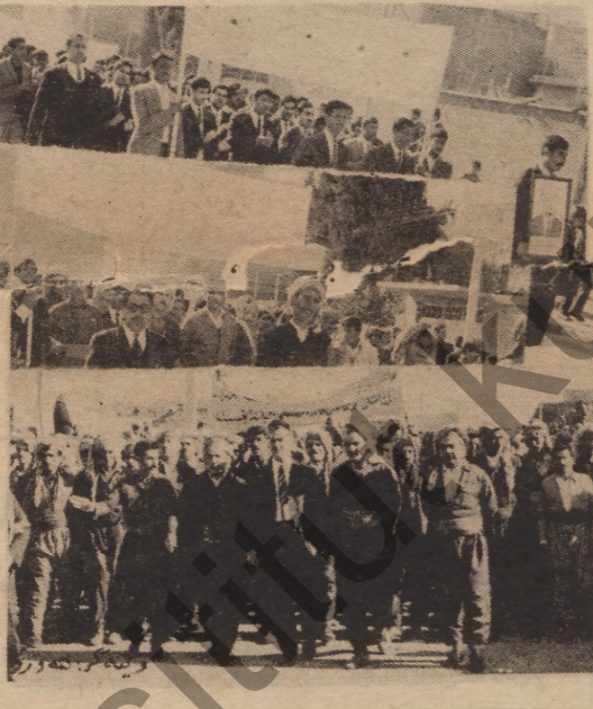
بیم بونه وه له هه لپزادا لیژنیکي بالا پیکهیرا له نوینهرانی پارسی دیموکراتی کوردستان و پارسی عریبی کوردستان و پارسی سوشالیست و پارسی کره یانی ( نافروه ) ماموستا