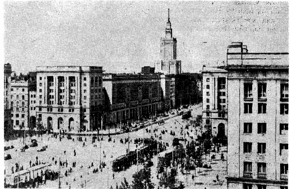
Республика Полшае Шьмаә'тиә. Мәйдана Конститут'сиае ль Варшавае.

1 июле һатийә қәдәндьне бь 108,6 сәләфа, йа ач'ар бь 122,8 сәләфа: