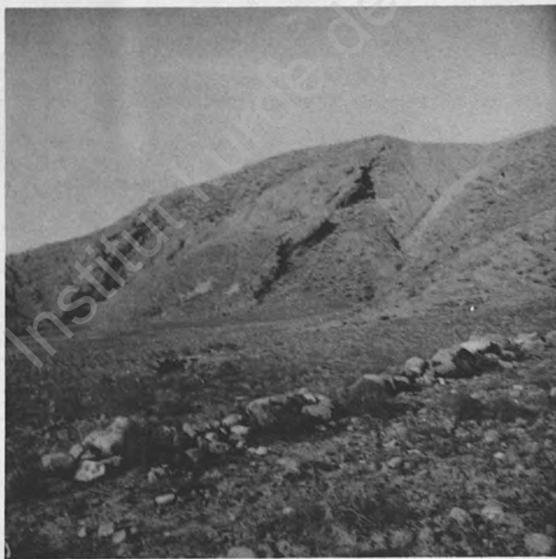
دىئى گورقەرەج لە رۆزھەلات بۆ رۆژئاوا

با بگەرئىنەوھ سەر باسى حاجى قادر ، دووبارە بزائين چۆن نووسەر هەول دەدا لەكە بخاتە ژيانى بەوھ . ديارە بە پىنەى باوهرى خۆى نەك هى ئىمە كە دەلق : ( لە تەك ئەمەدا هەلبەست بنووسى لە مەدحى عملى بەردە شانى كەشاىەرىكى مردووى لاتى كوردە ) (۱) .