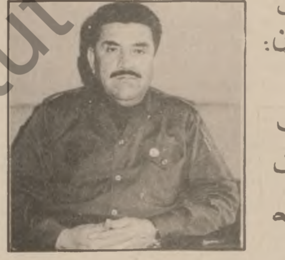
پروانە ل : ۱۱

جىگىرى سەبەكى يەكېتتى نەقابەكانى كرىكاران : گەلى غىراۋت لە ھەمىرۋ پىلانەكانى دۆرمان بە ھىزىتە بە بۇنەى بىرەۋەرى ئۆپەم سالەى دەرچوۋىۋ جى بەجى كوردنى ياساۋى ئۆتۈنۈمى ۋە ، چاۋمان كەۋت بە بەرپىز كاك مچىد جەبارى جىگىرى سەرەكى يەكېتتى گىشت نەقابەكانى كرىكارانى غىراقۋ ئەندامى لېۋنەى بالاي بەرەى نېشتمانىۋ نەتەۋەى پېشكەۋتۇخاۋۇ بەم بۇنەپەۋە لېمان پىرسى : بەكەن ، بەلام بېگومان مىللەتى غىراق بە كوردو غەرەبۋ كەمە نەتەۋەپەكانى تىرەۋە زۆر لە ۋاپلانانە بەھىزىتېرۋوۋو رۆژ لە دۋاى رۆژ زىبارى يەكېتسى نېشتمانىان پەۋرتروۋ بىسە تىن تر دەۋو ، ۋەكو ووتمان مەسەلەى كورد زۆر دەمىكە لە ئازادىۋ دەۋتائىن بلىتىن كەس تەبۋوچ لە حوكمرانانۋ كاربەدەستئانى غىراقۋ ج لە جىزبە سىياسىيەكانىش كە لە ئازادابوۋن بەراستى بىريان لەۋە ئەدەكردەۋە كە بەراستى چارەسەرى ئەۋ مەسەلە گىرگە بېكەن ، كىشەى كورد گەلې ھۇى سەرەكى ھەپە يەكەم لەبەرەۋەى كە غىراق لە شۋىتېكى ستراتېگىۋى سالە بىناغەيان دارشەۋە پاخۇد خاكەكەى داگىر بېكەن يا ھاۋۋولائىيانى كوت كىوت