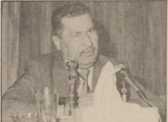
ئەركانى كە دەكەۋىتتە نەستۋى . بىن گومان پىشتىگىرى كوردنى دامەزراۋەكانى ئۆتۈنۈمى لەلاپەن سەرگىداپەتسى

x لە ماۋەى (۹) سالى جوتيارەكانمان كە بىسە شېۋەپەكى زانستىيانەۋ ئۆتۈنۈمى ، چۈن بزوتنەۋى كشتوكاڭى دەپىنن لە ئاۋچى كوردىستاندا . . . ؟ - ئاۋچەكە پېشسى خىستىكى بەرەپىدانى تەۋارى بەخۇپەۋە بېنى لە ھەمىرۋ لاپەننىكەۋە ، ئەك تەنەسا لە گەرتى كشتوكاڭى ۋە ، بەلكو لە لاپەنى ئاۋەدانىز بىيات نانسى گونەدە ھاۋچەرەكانۋ دوست - كوردنى رېگارىبانى نىۋىۋ گەلىك پىرۋى تر . . . بىرۋنەۋەى كشتوكاڭى . . . دەزگاكان دەۋرى سەرەكى خۇيان بىنىۋە لە بەشدارى كوردىيان لە جى بەجى كوردنى كارى كشتوكاڭلۋ راپەرپىتىۋ تېگەباندەنى بىسرا