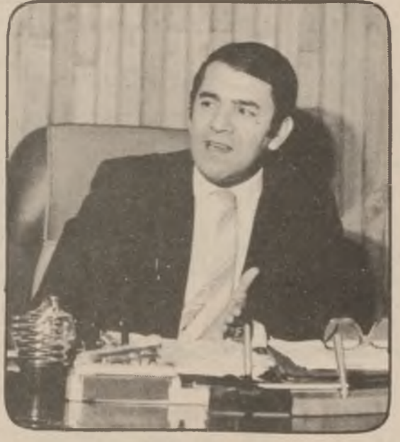
سەرەكى ئەنجومەنى راپەراندى ئاۋچى كوردىستان