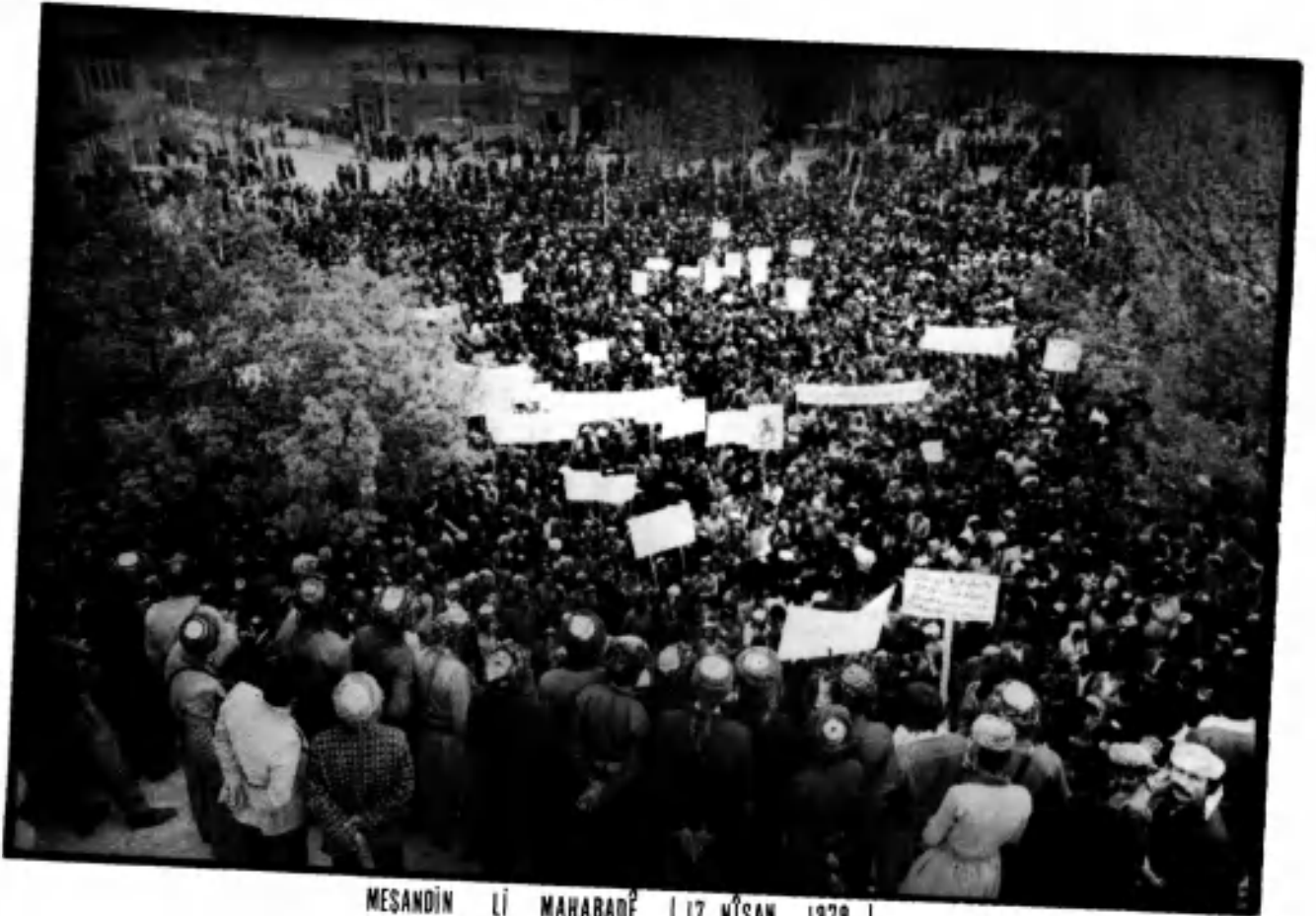
MEŞANDÎN LI MAHABADÊ (17 MÎSAN 1979)