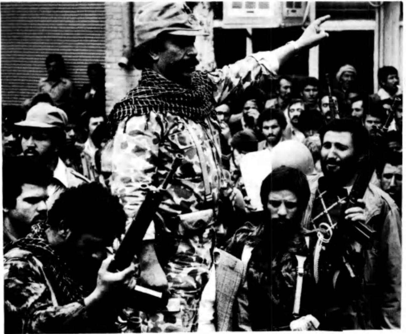
PASDAR: S.S. ÊN XWÎNRÊJÊN XOMEYNÎ LI BAJARÊ NAXADÊ (22 NÎSAN 1979)

bi destê wî nakeve, ew hê di meha nîsanê de mecbûrî lîdî jî hêzên hikûmetê şerkirinê bû.