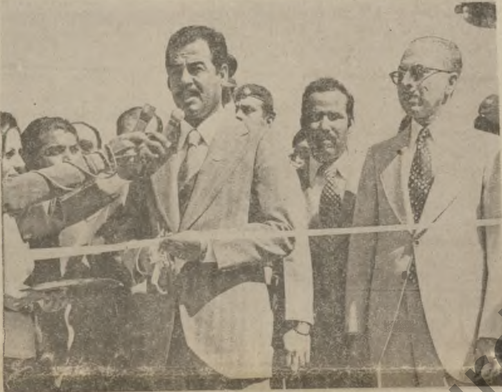
لە زین چاوەرێ سەرۆکی فەرماندە احمد حسن البکر سەر لە بە یانی رۆژی یە کە شەمەمی رابوردو بەرێ صدام حسین جی گری سەرۆکی کەنجو مەنی سەر کردایەتی شۆرش لە ئاھەنگی گەوردا پرۆژە ئی کە ئی سەر ساری فورتی کردووە .

مەدالیای رافدین بۆ ئیشتیگەرانی سوقیەتی و عیراقی لە پرۆژە کەدا لە جیاتی سەرۆکی فەرماندە احمد حسن بکر ، ماموستا صدام حسین مەدالیای رافدین بەلەبی دووھمی (چۆری مەدەنی) دا بە سەرۆکی شارەزایی سوقیەتی لە ئیشتیگەرانی پرۆژە نەرتر و ئەندازێار محمد فضل حسین بەرێوە بەرێ پرۆژە کە ماموستا صدام حسین لە کاتی پیشکەش کردنی مەدالیاکەدا وتی : ( بەرێ ناردووە فەرمانی سەرۆکی ئیشتیگەر کە احمد حسن بکر و بریاری سەر کردایەتی حزبو شۆرش پرسیارماندا مەدالیای رافدینشان خەلات بکەین لە جگە ئیو هەوڵو تەقەلا مەزنی داواتانە بۆ جیھانی کردنی ئەو پرۆژە کە پرۆژە ماموستا صدام حسین مەدالیای رافدینتی بە عەرەم شارەزایی عیراقی و سوقیەتی دا .