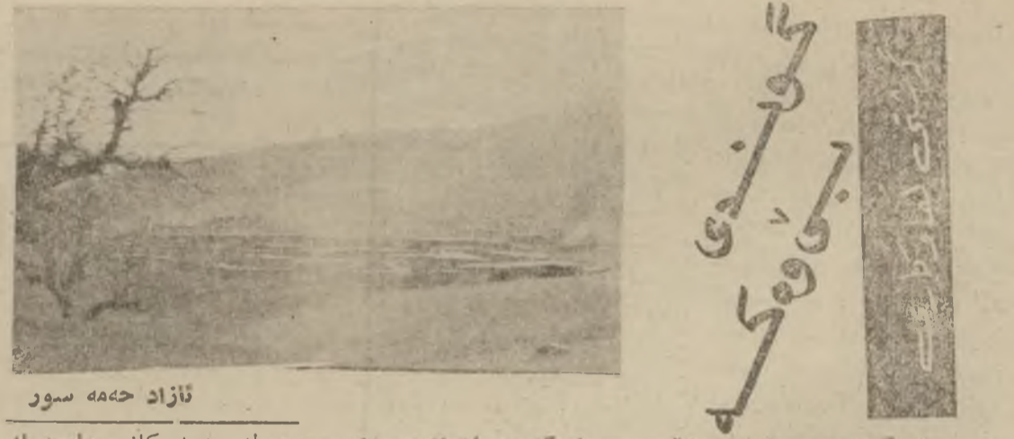
نازاد حهه سور