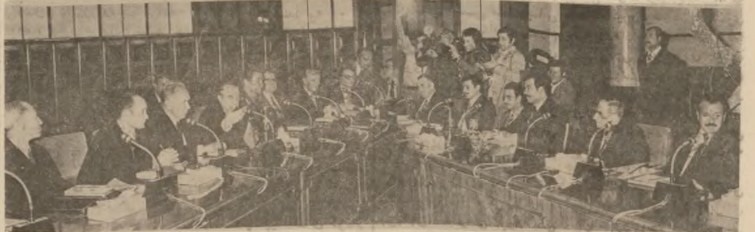
هغه وخت چې د دووقولې نيوان عيراق د پلويانو د لاسه راوړلو په وخت کې د دوی د لاسه راوړلو په وخت کې د دوی د لاسه راوړلو په وخت کې...

له سهر بانگ راهيشـنتي سهرگرديايتي حيزي به عسي سوسياليستي عهربو حکومتی کوماری عراق هه قال ټه ليکسي . ن . کوسيجين ټه ندهامی مه کته بي سياسي کوميتهی ناوه ندي پارتي کومونيسيټي يه کيټي سوځيټ و سهرهک وه زيواني يه کيټي سوځيټ له ۲۹ ټه ياره وه تا يه کيټي حوزه يواني ۱۹۷۶ به سهردان يکي ره سمی و دوستانه هاته کوماری عراق .