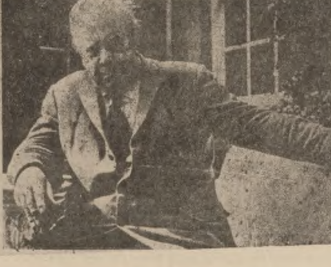
ناماده کردني : جمال معهد

نم چيرکي که ناو دهر کي کزيمدی رخنه گرانای هه په ، له پيشه وه به دوو بهش چاپ کراوه ، به لام له جاي تازه يدا هردوو بهش که له پک کتيداده نه ئی .