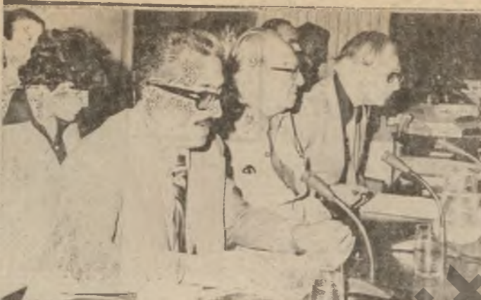
سهروکری فرمانده ساری سعادتیک به ناو یاخچه کانددا کراو به خه لانی خه لانی به ختیارم که نیوه به به ختیارم...