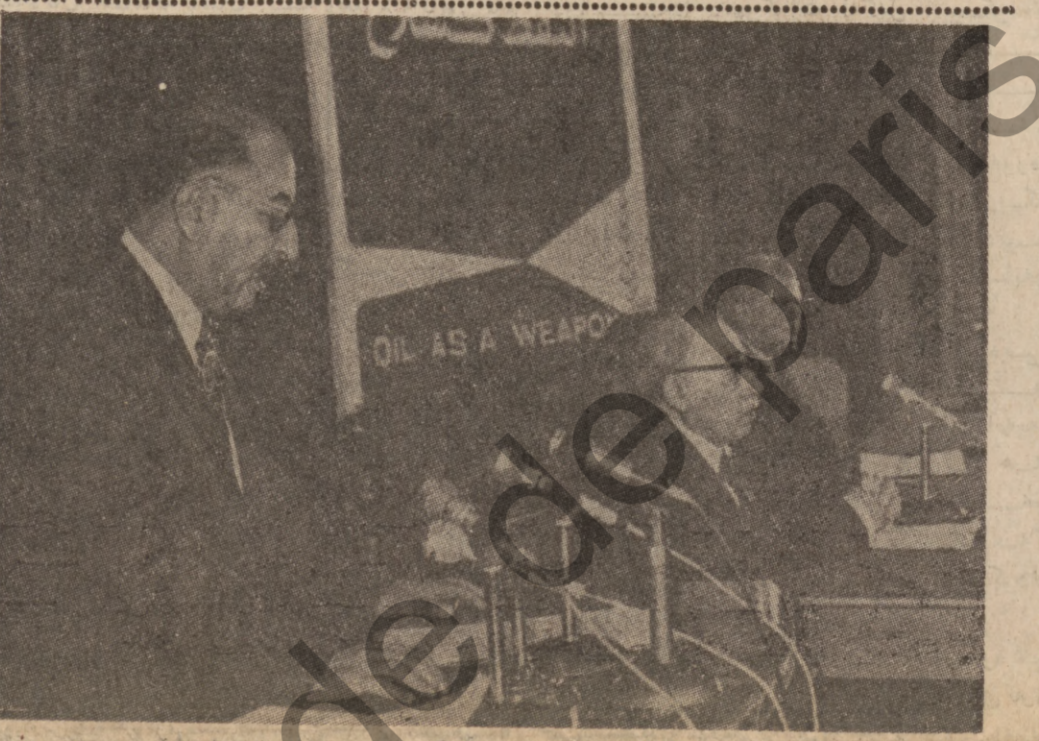
به سه ربه رشتى سه رو كمارك احمد حسن بكر رۆزى ۱۱ له هؤلى - خند - سيمينارى - نه وه جيهانى نهوت له زير دروشمى ( نهوت وه كو جه كينكى تيكوشان دزى ئيمير ياليزم و ده ست دزيريه كاني ئيسرائيل وه هؤى په ره بيتدانى ئابورى سه ربه خؤيه ) كرايه وه ( پروه له ياره ۲- )

كۆبون وهى وه زيرانى ده ره وه به رگرى عه ره ب كويت : ۱۰ د : به سه ربه رشتى كاك محمود رياض سكترى گشتى ده زگاي ولاتانى عه ره ب رۆزى ۱۱-۱۰ وه زيرانى ده ره وه به رگرى ولاتانى عه ره ب ئه كويت كۆبون وهى (۱۸) وه زيرى ده ره وه به رگرى ۱۲ ولاتى عه ره بى به شداد بوه كه ئه مانه ن : كويت ، ميسر ، سووريا ، ليبيا ، جه زاير ، سوودان ، سعوديه ، لبنان ، مراكيش ، تونس ، ئه رده ن عىراق و وه فديكى بيتشه ركه تانى فه لستين و ئه ميندريتى كشتى ده زگاي ولاتانى عه ره ب * وه وه فدى عىراق له م كۆبون وه يدا به سه رو كايه تي كاك مرتضى سعيد عبدالباقى وه زيرى ده ره وه و ئه ندايتى عبدالحسين جمالى يازيده ده رى وه زيرى ده ره وه محمد صبرى الحديدي بليوزى عىراق له كونتو سه ره كى فروكه وان حيد شعيان و ليوار كين يازيده ده رى سويا سالارو عيبد ركن به ربه ربه رى نيشتمانى عه سكه رى بوه *