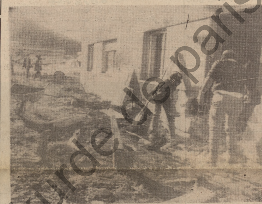
● شام : ئەسۆشیتەدېرىس : رۆزى ۲۱-۱۱ هیزەكانى سوپاچەند ( مەسحەبە ) بەكى ئىسرائىلەيان گەنم گردى تۆپ باران كۆردووە زىيانىكى گەورە بان لى داووە . لەم وتە بەدا شۆبەواری ئەم تۆپ باران كۆردنە دەرئۆبەرى

سەرگەوتنى پارتى سوشىيال ديموكرات لە هەلئار دندا بون : ۲۱-۱۱ رۆيتەر : سەرلەنوڤى پارتى سوشىيال ديموكرات كە فىلى برات سەرۆكايىتى لە هەلئار دندا سەرگەوت ، وە ۴۸ كورسى لە بوندشتاكي ئەلمانىيەى رۆژناوای دەسگەوتووە . پارتى سوشىيال ديموكرات لە شەرى دوومى دىباوە تانىستا ئەمە كەورە برىن سەرگەوتنە كە لە هەلئار دندا ئەندامانى گەنجومەنى ئۆتۆراندە بە دەست ئەمىنى ، ئەو بو لەم هەلئار د- ندا ۲۳ كورسى دەستگەوت ئەوى شايانەى باس بىت پارتى ديموكراتى ئازادىخوازان ۴۲ كورسى و ديموكراتى مەسحىبە كان ۲۴ كورسىيان بە دەست ئەتوانووە . ئەو سىياسەتەى ئىيران و حەشە ئەبىرگنە بەر ئاسایش ئىسرائىل ئەپاڤىتۆر بەشۆبە بەكى راستەو خۆو ناراستەو خۆو لە گەل سىياسەتى ئىسرائىلدا بەك ئەگرتەووە ، ئەو سىياسەتەش برۆيتى بە لەبەرشو بلاوگر دنى هیزەكانى عەرەب بۆ ئەوى بە ئاسانى بئوانى دەستيان لىن بۆه شىتۆرى . هېركايى وتۆبە : سوپا ئىران هېزىگى يەدەگى پاڤىشتى ئىسرائىل ، چونكە ئەو ئەركەى بو سوپا سپىردراووە هەمان ئەركە كە ئىسرائىل .