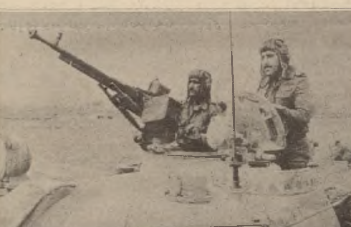
نوما ، شهري روهامان، دزي رومي جادو و گهره كاني فو تاران يني نايه مانگي توبه موهو ، چونكه زمه له سر رنبازي حق خوازي ده ستان دايه چكه و چوون به گز چاور پسيه يي نواندا ،

نومه نو مانگه و نيمه هه سر ده كوي و نوان هه نوچ دهنه ، كه چي نوان هه خويان به وه ده خه تين كويه ، سر ده نون! خويان ده خه تين و كه لاني نيران ده كهن به سوته مهي شريك نه پويستوه و نايه ويت ، پويه نير روي نه وه هاتوره ، نه و گه لانه راپه و نه به يان له ميه زيانر به شين و ناچار يان بكن وه لامي خواسته روه اواني گه لاني نيران به نوه و ناچار يان بكن وه لامي خواسته روه اواني شويش به نوه . گه لاني نيران به نوه و ويران و چه ساندنوه به لوه ، سره ياي نه مش توشي شريك و ايب شوماري كړدو تا بوخه وانه كاني ناو خويان بشاره وه به لام نه و باره به رده وادي ، نايته ، نه و نه ي به پوهندي به شهري شنه هيدني نيمه و به ، سوپاي قاسيه ي صدام هه سر ده كويته و نوان هه ر دشكين ، بيكومان ، له ناو نيرانيدا گه لاني نيران تا سر ماوه نادن به و تاقه جادو و گهره ي له قم تاران خزون ياري به چاره نويسان بكنه و دوا روي ره شيان نريكه .