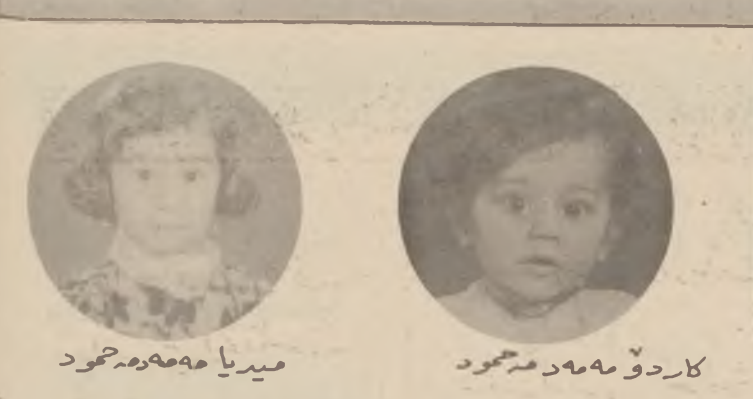
مىردىا هەمەمە محمد

دەزگى رۆشنىبىرى و بلاو كوردەوى كوردى بىسەم زووانە نىزى هەبه مېرەدچانىكى كەورە شىبىرى سىاسى رىك بخت تا دەكى شاعىرانى كورد تىكەل به دەنگى دلترمانى مەبدانى قارەمانى و فېداكارى جەدى قادىسى صدام بىت .