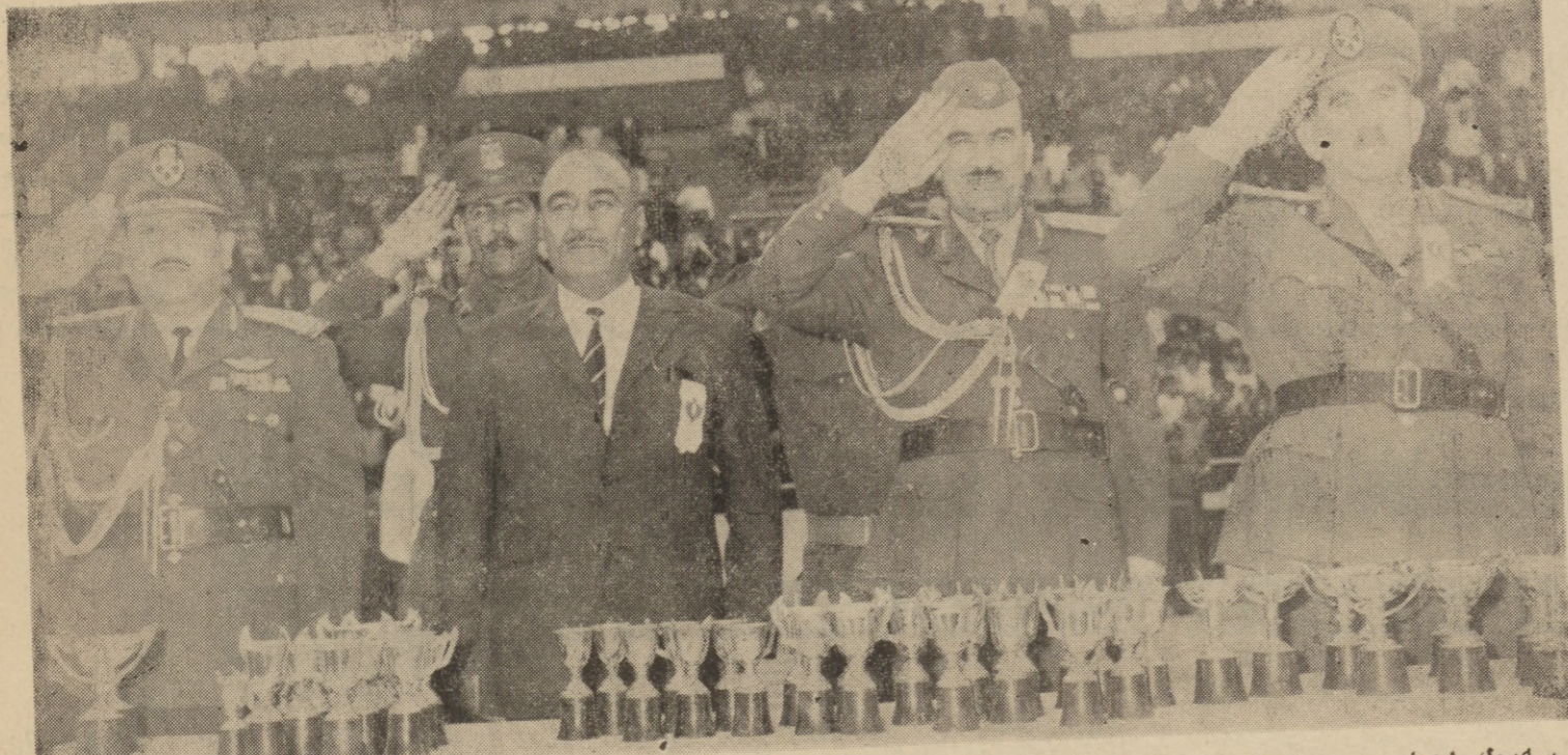
سهرهک احمد حسن البکر سهرهک کۆمارو سهرکردهی گهل عراقو فهرداندهی گشتی هیزه چه کارداره کان له رۆژی پیننج شه مه ی رابوردو سهر پهرشتمی ئاههنگه گهوره بهی کردله له فرۆخانه ی - مثنی - گهیرا به یۆنهیی عهراقیوه گهیرا .

کۆمارو فهرداندهی گشتی هیزه چه کارداره کان کردو مدخی شوژی ۱۷ تهوری کرد له گرنگی دانی به چه ک دار کردی هیزی ئاسمانی . وه به یمانی نۆی کردوه که تم هیزه بهوه فابری بهرامهر نامانجه کانی نهتهوه شوژی ۱۷ تهوری عماش به کیتی و نازادی سهرهستی دا . هیزی ئاسمانی پیننج شه مه ی سهرهک کۆمار کرد ، که فریق هیزی ئاسمانی عراقهوه له یاریگی گهل ریک خرا که ههزارو دووسه قونای بهشداریان تیا کرد . پینچکه لهوهی که فرۆکهوانه نازکان چه نه جولا نهوه بهکی جوانی فرۆکهوانیان له ئاسمانهوه پیشان دا .