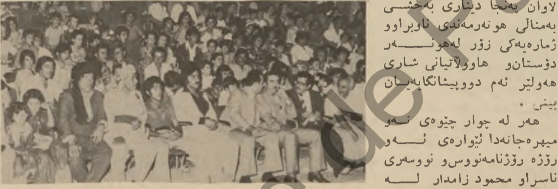
له میهره جانی سالی مندلانی جیهانی