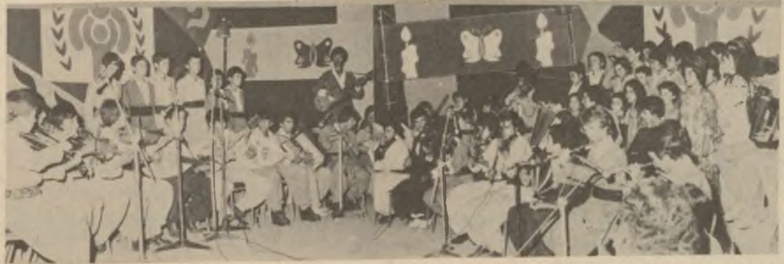
له میهره جانی سالی مندلانی جیهانی

به سرپرستی هونرمندی ناسراو وریا احمدو تپسی موزیقای منلانی رهوانسوز به سرپرستی هونرمندی زرار احمدو پینج منالاسی هونرمندی به شداریان کرد .