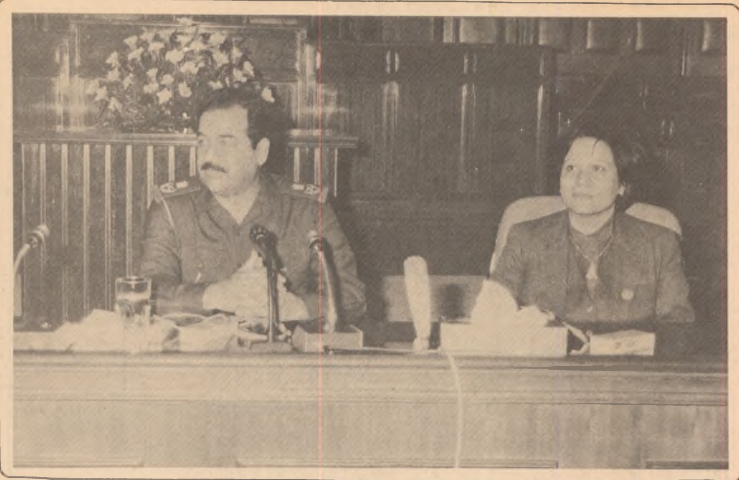
دهقی وتاری سهره کی فهرا مانده صدام حسین

له پیشوازی کردنی نهو وه فدانهی ئافره تانی جیهان که له کۆری ئافره تانی جیهاندا له بهغدا به شداری بان کرد