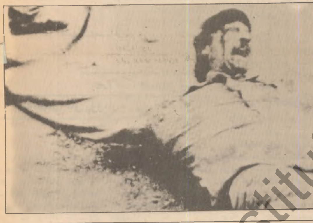
٤ - رابن :

رابن . . رابن هوین مری نین ل بن ناخن و به رابن چ نه مایه . . دسته لاتداره هموی نوکرو ستمکار هموی تاوانکار و به دار هند ژ ترسا دا دئی مرن هند دئی رهفن!! رابن دستتید ههف بکر سهرفی جهلادا بپرن تختی وان بله ریزین دلن وان بله ریزین جهوسینه را بیه ریزین دگوزف و کولک و شکفتادا گوشتن وانا بریزین دهرفته ناشادی بن تنگه ل کاروانن سه ره سنی بن . . ل ریتنکیده نازادی بن بو درهنگه و هیتزا ل سه راسسه ری و هلاتن من . . جهنگه . . جهنگه . . . . .