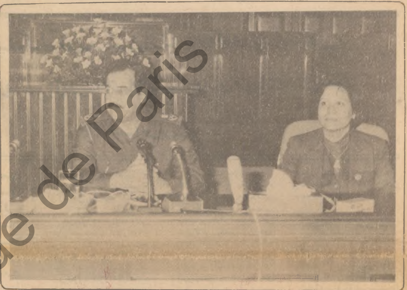
به ریز سهره کی فرمانده صدام حسین چاوی به وه فده گانی کوری

روژمی خومهینی نامرد جاریکی که بهرده لهرووی ناشیرینی خوی لاریو تهه لایه کی یساره کوی نمدانی به گینسی هاوولایه کانی دوو بات کردو جاریکی که نهو روژمه نه فامی و تهه لایه کی خوی سه لاند . به لام ئیوه ، نهی عیراقی به ممرده کان ، خوا ده زانی که ئیوه خاوهن حه قنو به رگری له ده کن و چونکه ئیوه زیان بنیان ده بیزن له سایه خیری سهر کردندا بوختیری گمل بوئه هه میسه سهر کردندا بوختیری .