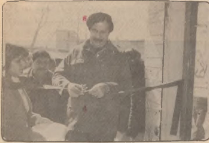
نه کرد ، دژی کورد کانسسی کوردستانی ئیران . .

پیش هاتسی روژی ۲-۹ شاری سلیمانی . . هموو کوچه شهقام شویتنه گشتیه کانی رازانه بووه .