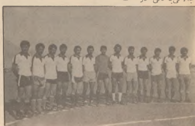
گهله - باشماوه

بۆ زیاتر زانین و نریش بوونه وه له چالاکی به زوره کانی نهم تیبه ، هه زمان کرد جاومان به راهینه ری تیب کساک (وشییار فتاح) بکهوئ . . نویش بهم جزره له تیبو چالاکی به کانی دوا .