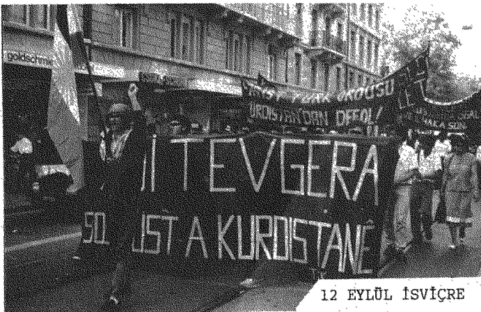
12 EYLÜL İSVİÇRE