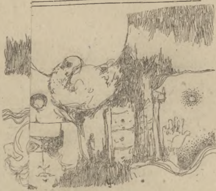
شیر کو بیگ