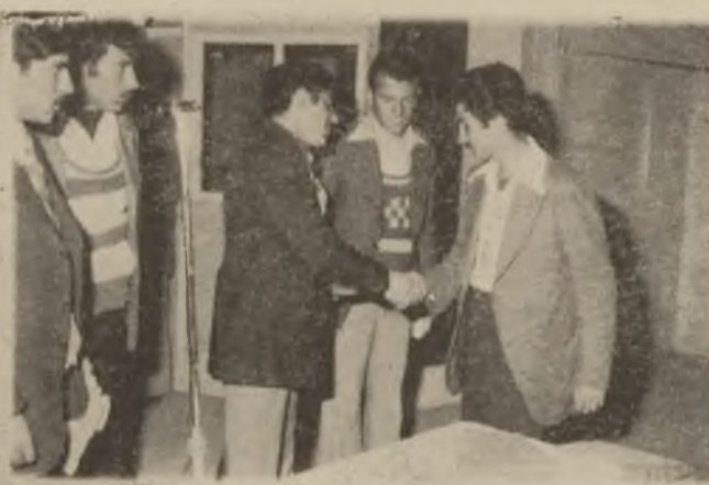
چێگای خۆیەتی مێهەر جێهێناوە ئەهەدی بەم جۆرە لە هەولێر و هەموو شارەکانی تری هەولێر بکرتەوه، تا سەر هەتای پانگەوازی شیعرو دەنگی راستی قوتاییان دەست پێ بکات .

پۆ ئەوهی بێر و باوەرێ حزب دەر بێر کە ئەم سەر کردایە گەلی عێراق ئە کات وە بە تاییەتی بە نێسبەت تاوچە کوردستانەوه کەسە ماوهێکی درێژ بوو کەوتیوه ژێر دەسلاتی دەر بەگەتو چەوسێنەران، پۆ ئەمەش