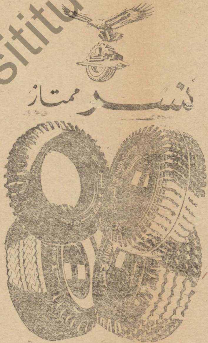
الوكلاء المأتمون في العراق

اننا نعتقد بان اجسامنا افخر مما نملك وان الصحة اعظم ثروة في الوجود وان كل ما من شأنه يحول بيننا وبين الصحة يجب ان نخذره . اننا نملك بقولنا ان الضعف جرمه وان المرض عقاب عادل للنعدى على قوانين الصحة . وان في استطاعة كل رجل ان يكون مثالا حيا للرجولة الحقيقية ، وان في استطاعة كل فتاة ان تكون قويه بجسم متناسق منسجم يمثل الانوثة الصادقة . اذا راعينا قوانين الحياة بدقة وأمانه واحمها التغذية ولو كان اثر سوء التغذية يتمي عند افساد قوام الجسم لم ان الامر . غير ان العلة الكبرى هي اثره في