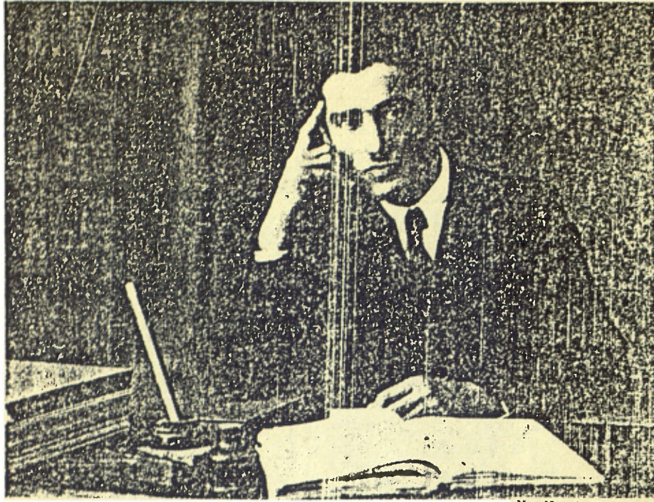
M. Nuri Dersimi