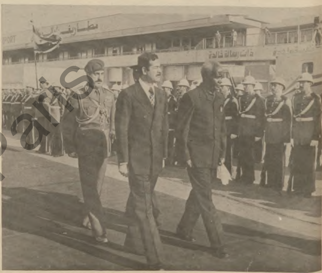
سەئۇدىيە مىسرىسى ۋە زىكاردى لىبەرىيەسى تىككىرىنى جىياۋزىي ۋە زىكاردى

ۋە زىكاردى لىبەرىيەسى تىككىرىنى جىياۋزىي ۋە زىكاردى ۋە زىكاردى لىبەرىيەسى تىككىرىنى جىياۋزىي ۋە زىكاردى