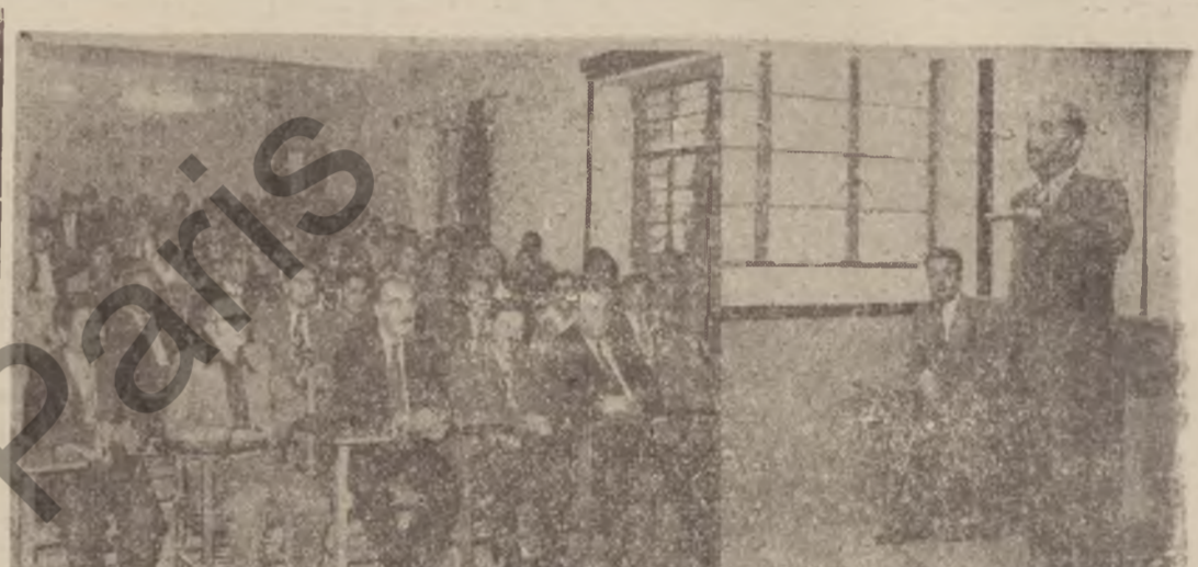
سه روک به كر له به يمانگى ته گه لوجيا ساغى كرده كه :