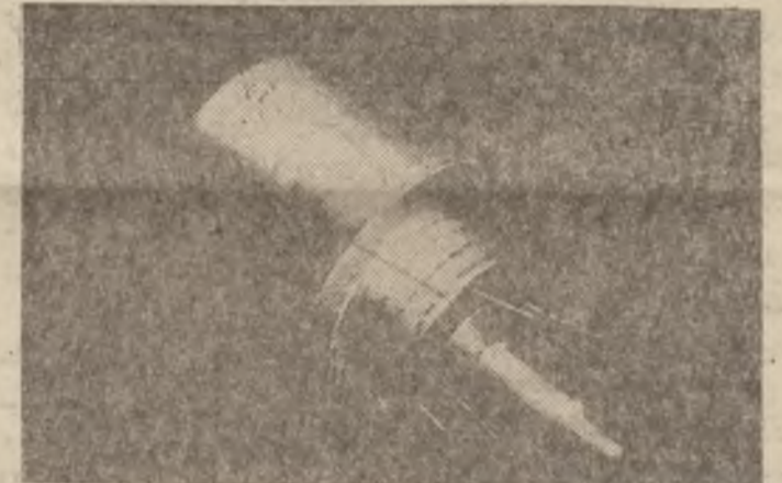
«میتلسیوسان» گه شتی به کی دهسگری له باری ناوو ههوا نه کۆلینتیهوه

۱- سوورین و پاکر دهنوهی ددان ۰ تاکو نازار نه گاته پوک بیوسته ههوه رۆژن به فلجه پاک کیرتیهوه باشریش وایه فلجه که نایلون بیت و پانیی (سم) و درزی له (۲-۳) سم ۲- شیلانی پوک ۰