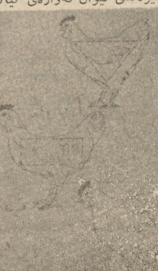
بروانه ل ۷

قوارهی له شی مریشک و په یوه ندی به جورئ به راهم هینانیه وه نامانجان له لیکولینه وه ی به یوه ندی تیوان قه واری گیانی