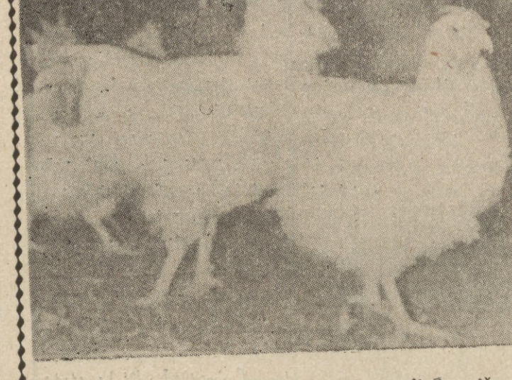
وینه ی گیانی مریشک له روی به راهم هینانی جور