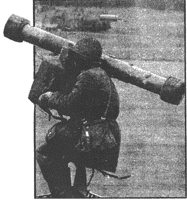
Olof Palme cinayetine neden olabilecek ve kaçak olarak satılan Robot-70'lerden biri

Son günlerde, polis ile adli komisyon arasında tartışma konusu olan ihtimaller ön plana çıkmış durumda. Adli komisyon Palme'nin özel hayatı ve İsveç silah tekeli Bofors ile ilgili derinlemesine araştırma yapılması gerektiğine inanıyor. 1 Mart 1987 tarihinde Amerikalı yazar Richard Reeves, New York Post'ta yazdığı uzun bir makalede İsveç'in en büyük silah tekeli Bofors'un Palme'ye rağmen İran'a kaçak olarak robot 70 denen silah-