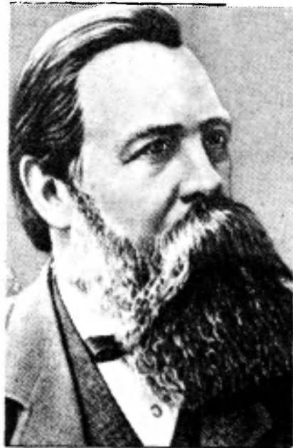
F. ENGELS (1820-1895)

1. Hê di dawiya sedsa la X a de, lê bi hîmtî di sedsala XI a de, li Almanyê "tevgerekt bajarvanî" tê dîtin. Bajarok, bajar û şaristanên nûza, yê ku heta hingê di bin nî rê abort û hiqûqî yê began de bûn, digîhên hev, hevdesaz dibin jibo bidestxistina a zadiya xwe (coniuratio civium an Schwurverband). Kel û dizên pêştî (dtwar, paşê sûr: Pfahlbau, Stadtmauer) nîşanên serxwebûn û xweseriyê (otonomiyê) li Almanyê ji sedsala XI a ne; niha jî pirtîcar ew di derefşên şaristanan de xuya ne (nîşeya Engels).