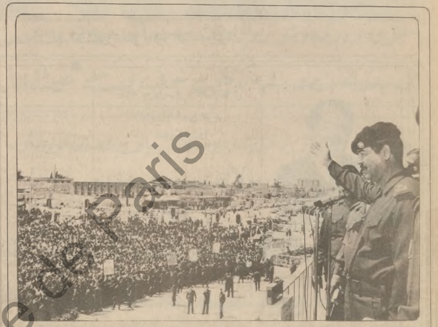
سه رگرده وه هه لمانده نی رۆژنامه ی ناوچدی کوردستان

کوده تابه کی سپی له سووان رۆزی شه ممه ی رابووردو له ولاتی سووان به کوده تابه کی سپی سواریا ده ستی به سه ره جوکه دا گرتوو جعفر نه مری سه ره ک ئوماری له کار خست .