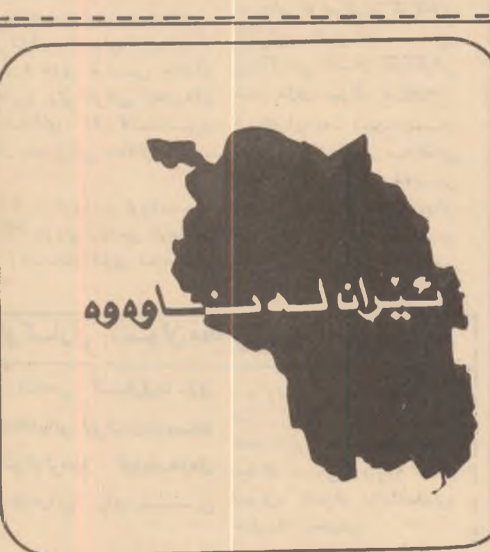
فؤاد حسین په‌ڕینی و سه‌زادان و له‌سه‌تاره‌دانی ئێرانه‌که‌ . . ئهمانه‌وه‌ جگه‌ له‌به‌ندکردنی زیاتر له‌ ١٤٠ هه‌زار ئێرانی که دژ به‌ رۆژمه‌که‌ن . .

وه‌ له‌ ووتاره‌که‌یدا فه‌رمووی . با به‌خێ ئهم کۆرپه‌ له‌ ده‌وری مه‌زنی ئافره‌تی سه‌ره‌به‌هه‌وه‌ بۆ بنیات نانی کۆمه‌ڵ ده‌رته‌که‌وتنه‌وه‌ پیکه‌راوی ئافره‌تان له‌ نیشتمانی سه‌ره‌به‌یدا له‌ پشکینه‌وتن و به‌ره‌به‌یتدانیکی بالا دایه‌ بۆ هوشیار کردنه‌وه‌ی ئافره‌تی سه‌ره‌به‌خۆی و وزه‌ی خواروی بۆ هاوهمشی کردن به‌شێوه‌یه‌کی به‌تین تر له‌ جۆلانه‌وه‌ی پشکینه‌وتن خواروی دا . فه‌رمووی : سه‌ره‌زایه‌تی به‌سیاسه‌کانی ولاته‌ سه‌ره‌به‌یه‌کان بپه‌سته‌ با به‌خه‌تی زۆر به‌م پیکه‌راوانه‌ به‌دنه‌ .