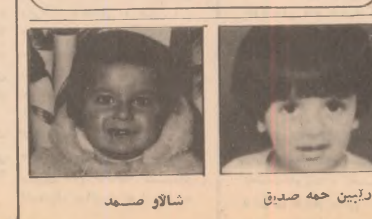
شالوو سه‌مه‌ دایین چه‌ صدیق چینه‌ر محمود - ئالوو رۆشناحسین

له‌ موه‌هندیسخانه‌ ئاردی بۆمبار و خشتی کس‌الو ته‌نه‌که‌ی چینکو ته‌فرۆشرین ، نه‌وه‌ی تالییه‌ موراجعه‌ت بکات نه‌وه‌ی تالییه‌ له‌ موه‌هندیسخانه‌ فیزی سه‌نه‌ت و ئۆتۆمۆبیلچینی بیه‌سه‌رته‌یک خۆتێنده‌وار بیت بۆ قه‌ید بوون موراجعه‌ت بکات