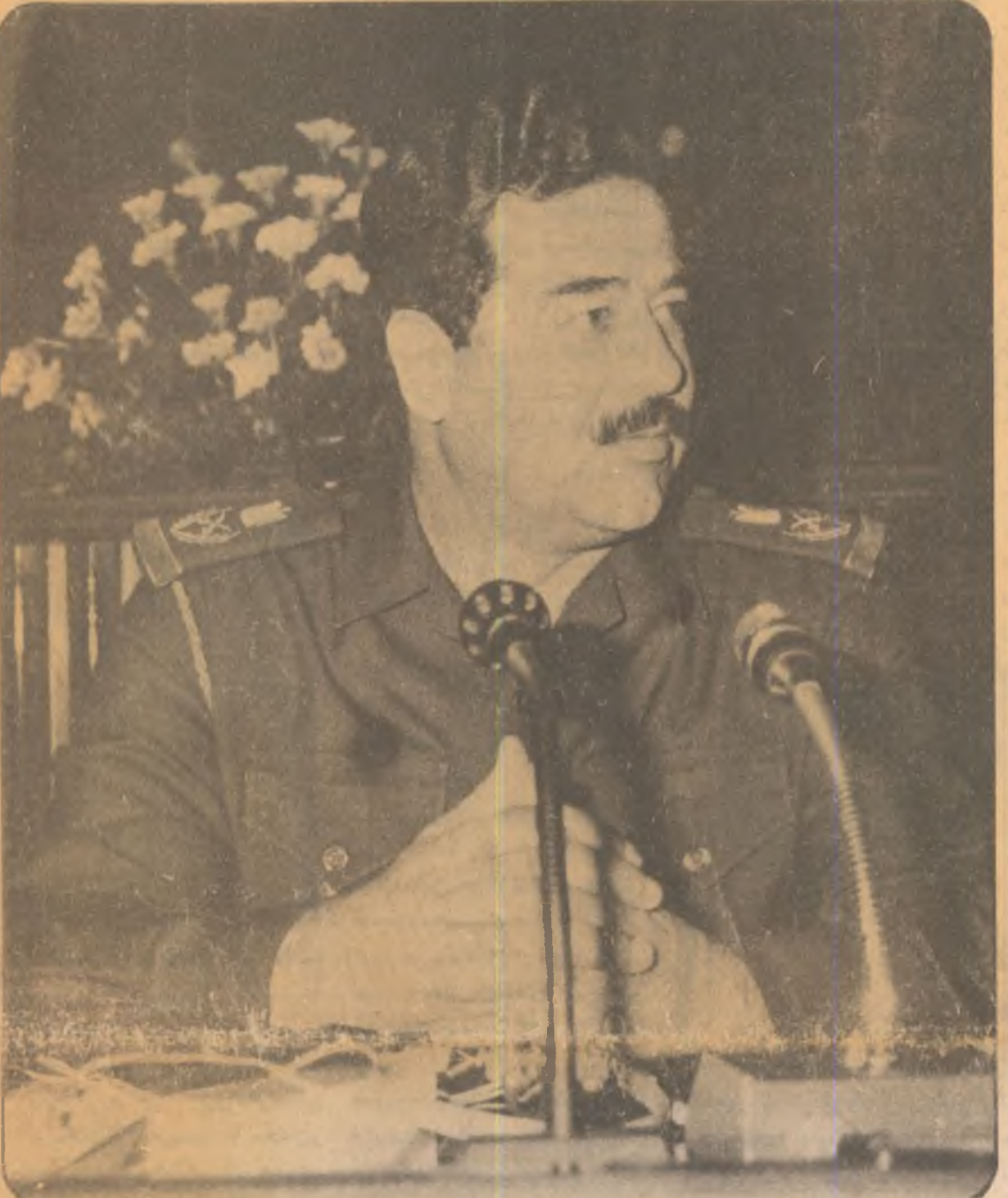
له جه ژنی کریکاراندا : دوو یانگردنه وهی توانای به قهس له وهی به که وه تواندا

دوینی به سه ر وهوشتی فه رمانده ی گه به ریز سه ر وهی فه رمانده صدام حسین کریکارانی عیرافی سه ر به روژنامه نیان به بونه ی روژی کریکارانی جه مانوه گرا .