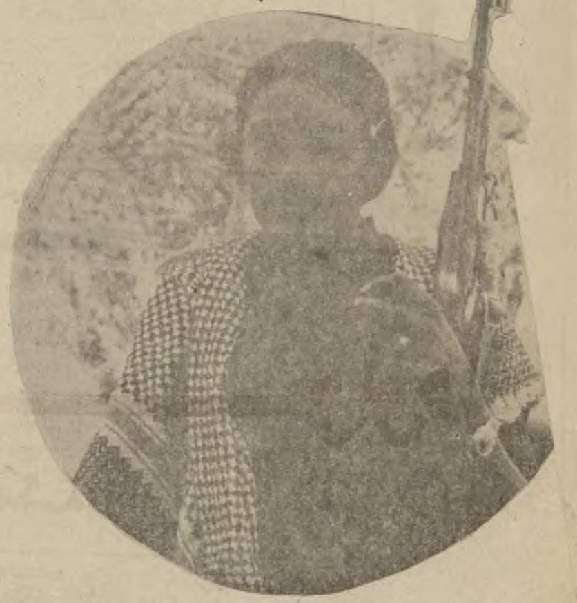
کاتېن چهاوهرې گهل، دژې چهاوهرې دژې سيمسټمې نهو سيماسه ته ناوړې بې بېندي نهکا، رانه بېرې، له واکاندا، بهشدار بونې نافرته، له واکاندا بېرته، نيشانه يه کي ديار نهين، په شوقشې دژې سيمسټمې کې دواکونوړې دچهاوسانه وې کومه لايه تي.