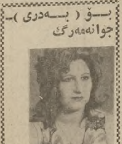
پاشا (بهدري) - جوانه هرگي

له صديق علي نامي سدي بهاميتري (هاواري) بهوه: جاريكي تر ناكري نوروژ، زكري سر به ستر خوشه ويستي له چي كاني كوردستاندا كرايهوه، پاريزگي (دهوك) يش بؤ نم جهزته نه توهه پي به كوچ رازاندهوه وهك همسر شوينه كاني توي ناوچيه نونومي ناكري نوروژي كردهوه، بؤ به پانيش جهاموه ويكي زور له شونئي تايبه تي نارهزه اما ده بون و ناهه نك دهستي پي كرو ماوسنا محمد صديق چي كاني پاريزگي دهوك به وتاريك ناهه نكه كسي كردهوه، دواي نهوه تپسي چالاكي هونمري سرددي نوروژي پيشكش كرو به هاربيگاري تپسي (مه نيه ندي لواني دهوك) يش جهندان سرود اوراني پيشكش كرا بيجه له جهندان تابليو هاربيگاري ناهه نكه كه به زوري هاشه نك دنگيريو كه له بهدي زوني جهزني نوروژي بيرورژا رون بكاتهوه. ده سال نامانجته شوخواري بؤ مشائيك بهده تكي گريانو نغمعي بيكه تپي سوزو مالي دورى كسه سو كارت له بير پانهوه. ده سال ناختم بؤ ههوه خوشي به كه هله نكيشا به له دايك يوني نيازي كورت ههوه خواسته كات زينده به حال گران، نه كه يشي بيخه يسه سهردلو تاسه ده سال چاوهر واليتي پي پيشكشني مهرت به زي به چيوالي زور بپ تاواني نهوه ساوايه دا نهماته وهه دهستي به شي نايبه كهدرت. فريشته گهم تيسا برسپاري ون يوني سوزي داك له چاوي كوزيه كه تا نه خونمه له ههوه فرميسكتا ويته شي بريني خوشكتيكي به ناوات نه كه يشتي تيا نه بينم تايا نه بين وهلامي برسپاري رورژاني داهاوتوي چون بدهمونه بهدي كيان. بهدل نياي سهر پيتره وه بهديانته نهدهمن بؤ كوزيه كه له دايك چاكتر بو له هيج روبه كوه بپ نازي نه كه م خوشكت قومري حسن