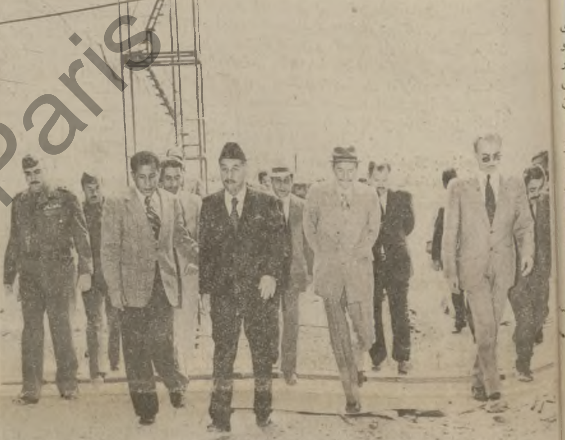
سهروکی فرمانده کاک احمد حسن بکر سه ره له به یانی ۳۰-۳۱ له گه ل کاک عزت دوری نه ندانی نه نجومه نی سهروک دایه تی شووش و سهروکی نه نجومه نی به ره ری کشتوکال سهریان له بر روژی که نالی (الثرار) دا . • وه له کانی که بوشکوه یان سهروکی فرمانده به گه رمی به وه له لایه کاک مکرم تاله یانی وه زیوی به ی و کاک مصطفی حمدون نه ندانی نه نجومه نی به روژی کشتوکال و محممد الجبوری به رو به به ری گشتی دامه ژواوی بر و ژوه که وه چنه سد کار به سه ری تروه بوشواوی کرا . • سهروکمه ره گشتیکی به ژواری بر و ژوه نه دا کسیر و نه ژواری نیش که وه کار به ده ستانی کردو داوا ی لوبنان که له کانی دیاری کراودا بر و ژوه که ته و او بکن . • وه له کو تابی سهراسه که ده که نه کیکی سن سهراسه عانی خایان سهروکمه ره له لایه له زیوی به ی و نه ندانی نه نجومه نی به روژی کشتوکال و به رو به به ری گشتی بر و ژوه که وه جه ماوه ری کریکار سه وه به چه به لوبنان و هار و کردن به یانی سهروک و سهروک دایه تی حزب و شووش سه وه به ی کرا .

به بۆنه ی راپه رینی هار و ولایه یانی خاکی زهوت کراوه وه روژی ۳۰-۳۱ له سهراسه ری ولایه کراو تیایدا جه ماوه به کی راپه رینه که بوشکوه ری جه ماوه ری کانی عه ره بمان نه کات له سهراسه ری و خاکی زهوت کراوی عه ره ب دزی شه وه ری ره که به ره سه ری ژاویزیزم .