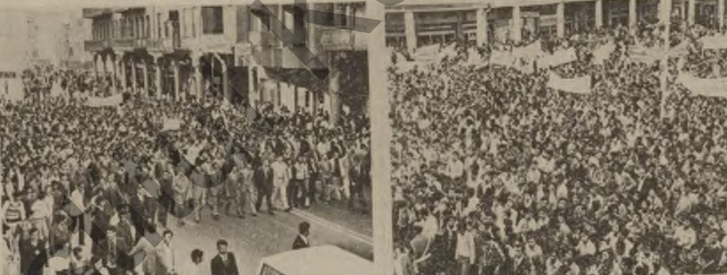
وه له سهراسه ده ی سه ره له به یانی دا هه مه و جه و هار و و جه که له شه قاشته کانی به غدا وه ستاو ریکارانی کار که و فابریقه ی سهراسه ری ولایه بۆ ماوه ی چاره که سهراسه ده یان له کار کردن هه لگرت و چه نه کوریکمان به ستو و تار یان تیادا خوینده وه .

واپو سن مانگ نه چن . جه ماوه ی قاره مان و جاو نه ترسی و ژور لوبنان خاکی فه له سه ری زهوت کراو نالی به گه راجون و به سه ری دورمه و خورا کر ته سی باله وانه ی شه و جه ماوه له ولایه زهوت کراوه که دا نه شه کیته وه ، دلیرانه و به وه به ی نازییه ی و بپاکانه ، رق و تو به ی خویان به رو ی ژاویزیزم دا نه شه کیته وه ، بپ سل کردنه وه له مردن در و ژوه به خه یانی شووش که ایمان نه دهن و کو و کچ و بیانو ژنیان تیکرا راپه ریون و داخی دی چه نه ساله ی چه وسانده وه و زیر ده ستانیان به سه ره داگیر کرا دا نه ژوون و هه له تیان نه به نه سهرو به ره کری له مانی زهوت کراویان نه کهن ، سل له قاشتی به ی و ره که به سه ری به تی دورمه ی دار ده سه ری نیجریالیزی نه مه ره بکا خوی شه رانگه نه وه . • جه ماوه ی ژور لوبنان فه له سه ری به وه لوبنان و هه لجه شه شووش که به سهراسه یان که به نه تیا خه یانی در بخاره یان و تیکوشانی چه گدارانه و به قورانی و خورا گرتن نه بن به سه ری دورمه بکری و له و ریکایه وه نه توان بکسه نه نامانجه به رو ی ژاویزیان و سهرو سه ره کوته به نه وه ، به بیجه وانه ی شه مه ، ده ست تیکه ل کردن و بشی بشی کردن و مل شووش کردن به راپه ره نیجریالیزی دورمه ی کردنی بردی ده ستانه ی به بروانه ل ۷