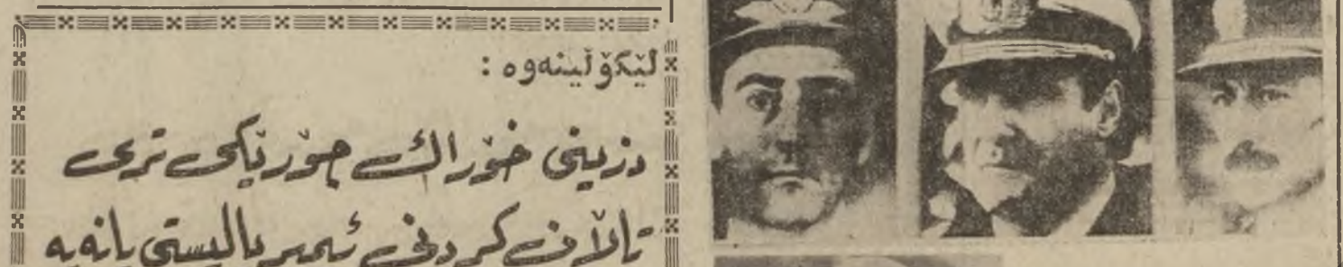
پوینس نه پریس - ۳/۲۴ ناوانسکان - هيزه چه کداره کاني نه مهنين ده سله ناي نهو تر نه ندمان له ميليشيا کي نهکا، رانه بېرې، له واکاندا، بهشدار بونې نافرته، له واکاندا بېرته، نيشانه يه کي ديار نهين، په شوقشې دژې سيمسټمې کې دواکونوړې دچهاوسانه وې کومه لايه تي.