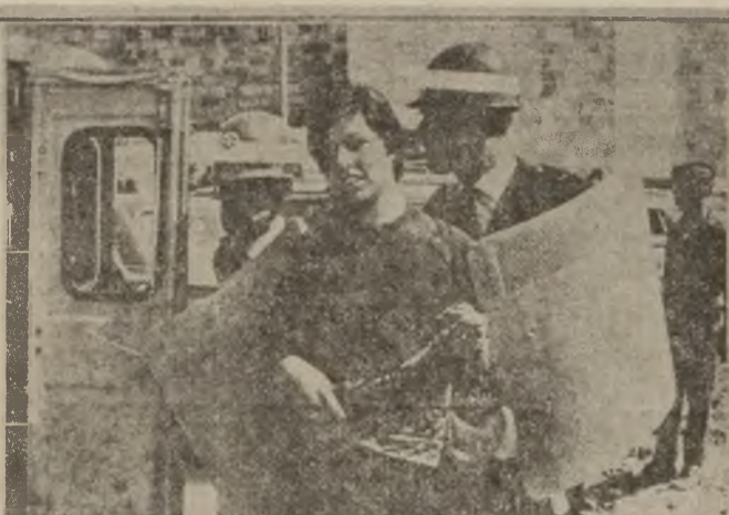
سلاوي خومان نه كه به نيشه كراواندا

له مو مانگرتني جهاموردي چوساوو به هلساو جهاموردي قوتايان پيدا بهشديان كړد ، بږ بهر بهج دانه ودي حكومت و هلسوكونه ناله باره كانيان . كه په سمې كولو بهل پيوستيان زور كړد .