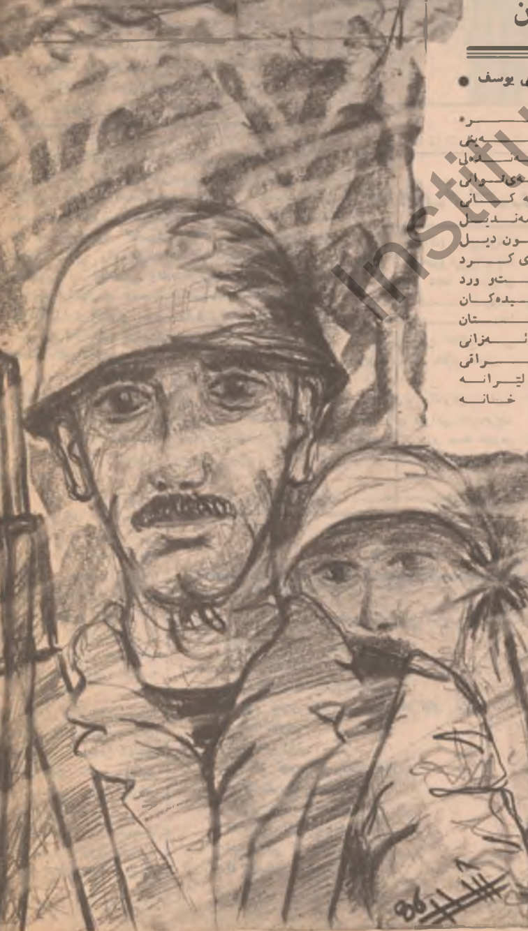
سوريا دەستىن ناگەت . .

ئىران زۆر بەناشكرا راي دەگەپەن كە مەمەستى داگىر كوردى مىراق و لىدانىسى شۇۋىش پىشكەۋەتۋو خۇۋە كە ئەم مىراقى خەستە قۇناقى گەشەندەن . . .