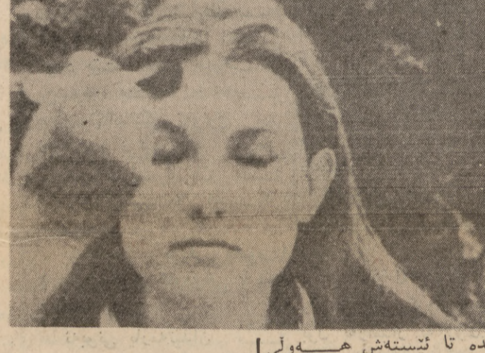
نازاد نه چه م

نه م یو سینه ما و فلمی سینه مای ، وه کو سینه مای دوین نه ماوه ، به لکو نه ویش وه کو هه مو به شه کانی تری هونه رو رۆشپهرو نه ده ب ، نه کۆری یرو با وه ره سیاسیه کانی نه م یو دا ده وری خۆی نه گری و ده وریکی به کاریش ، نه به گزا چونی هیزه کانی ژیم پریالی و دوژمه کانی سه ره سته ی و نازادی گه لان داوه ، سینه ما بۆ ته نه داتیکی به کاری خه بات کرن دن دزی هه مو هیز تکی چه وسینه رو زۆردارو برۆکرات له هه مو دنیا دا ، له لاکه ی تری شه وه دوژمه کانی سه ره - به سته ی نازادی گه لان نه م هونه ره بۆ مه به سته ی چه و تی خۆ بان به کار نه هین . هه رچه نه ده له ولاته که ی نیمه دا تا ئیسته شه هه ره نه جۆره فلیه سینه مایانه باون که له ولاتانی پیشکوه تو ده میتکه کاتیان به سه ره چوه وه هه رچه نه تا ئیسته شه هه وای به راستی نه درا وه نه و فلیه سینه مایانه مان پیشان به دن که خه مته مه سه له ی خه باتی که لانی چه سا وه نه کات ، به لکه ئیسته نه م جۆره فلیه ، بارادی زۆر ولاتانی تری پر کرد نه وه له به ربه ره کانیه کی به هیزی سینه مای تا قه سه سه ره مایه داره - کانایه . وه به ی پی به ی سینه ما بۆ ته نه داتیکی به کاری خه بات شاره ژان کان هونه ری سینه مانه و راستی به یان ساغ کرد نه وه که سینه مای بیلان له م رۆژدا تیه ، کۆفاری - کایبه دوژمه مای قه ره نسایی له م دوایه دا ژماره یه کی تایه تی ده رباره ی سینه مای سیاسیه قه ره نسایی به ناو نیشانی ( سینه ما و خه باتی چینه یه ته له قه ره نسا ) ده ره کرد وه » ژان لوک کۆدار « ده ره نه تی سینه مای ناسراوی قه ره نسا له ژماره یه دا ، بروانه ل ٧