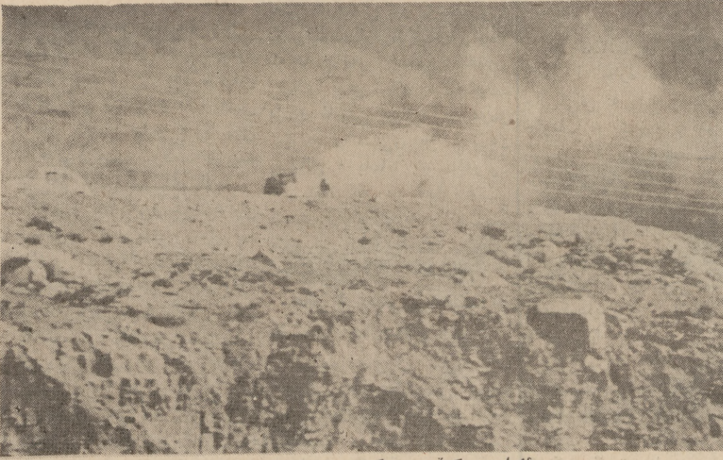
ناوا دووکه ئی مه کینه هه وای پیس نه کات

به پنی نه و رابوردانه ی ، نه و شاره ژاپانه بلاویان کرد نه وه ، مرۆف رۆژی ( ٢٥ ) ره تل هه وای هه هه نه مزی ، که نه وه هه وایه له سه هدا ده ی ته پو تو زو ماده ی زیان به خشی تیا به وه کو ( فله مینیوم و یوتاسیوم و ناسن و کلورین و سیلیکوت و کوردو به کم نوکسیدی کاربون و دو نوکسیدی سو دیوم و کسیدی نا یتر و جیو هیدرو کاربونات ) نه م شته نه هه وای به جوری تیکه له هه وای بون که به چه سا و نا بیترین و شاره ژان کان توایر یانه به هوی - میکرو سکوی نه لکترو ن - به هه ده ست نیشانیان بکن ، مانه وه ی نه م ماده نه شه له له می مرۆفا راسته وه خۆ کار نه کاته سه ر ته ندروستی گشتی و به تایه تی سه ر مینخ و ده ی مرۆف .