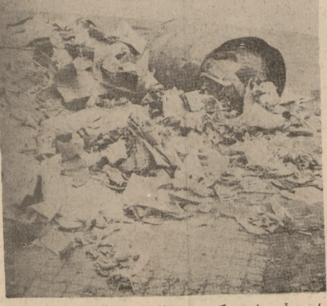
هه وای هه ئی شتوه کی پیس و فری دراو به سه رو چاوما نا نه چیت