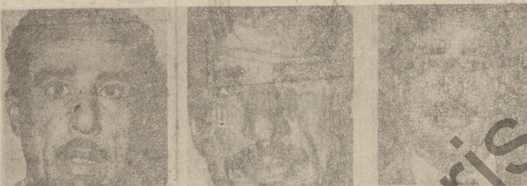
عالب کاظم هضم، عه ل حسین حسون، حاجه کاظم هضم