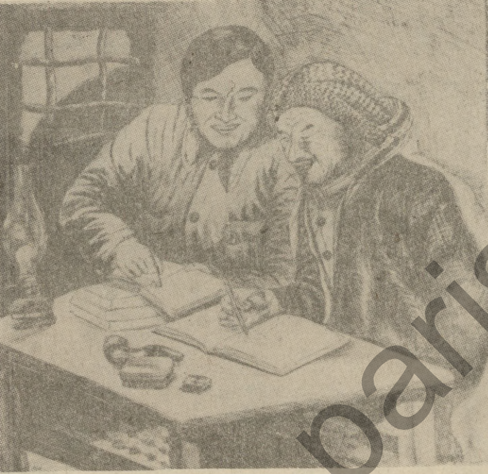
یه کات که بهر هه هه هونه ربه کانی

کاک خالد نه لای : له بؤله کانی سهره تاییهوه هونه ری وینه کیشان خزایه ناو دروونهوه ، هه رجه ند تانیسته مان نه دراووم بهلام هه سستو نی بییو نارزهوی خستم نازاده یه که خستوه ههرده . سستم به نیکارکیشان کردوه . هه رجه ند پیوسته هونه هه ند نی کورد نه ک تانیست