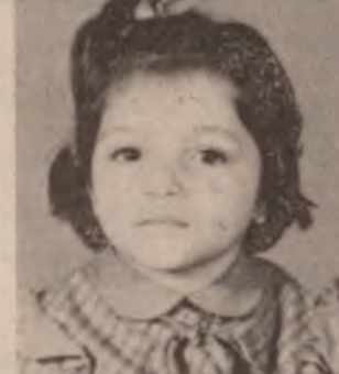
بنار موهکرم رهشید