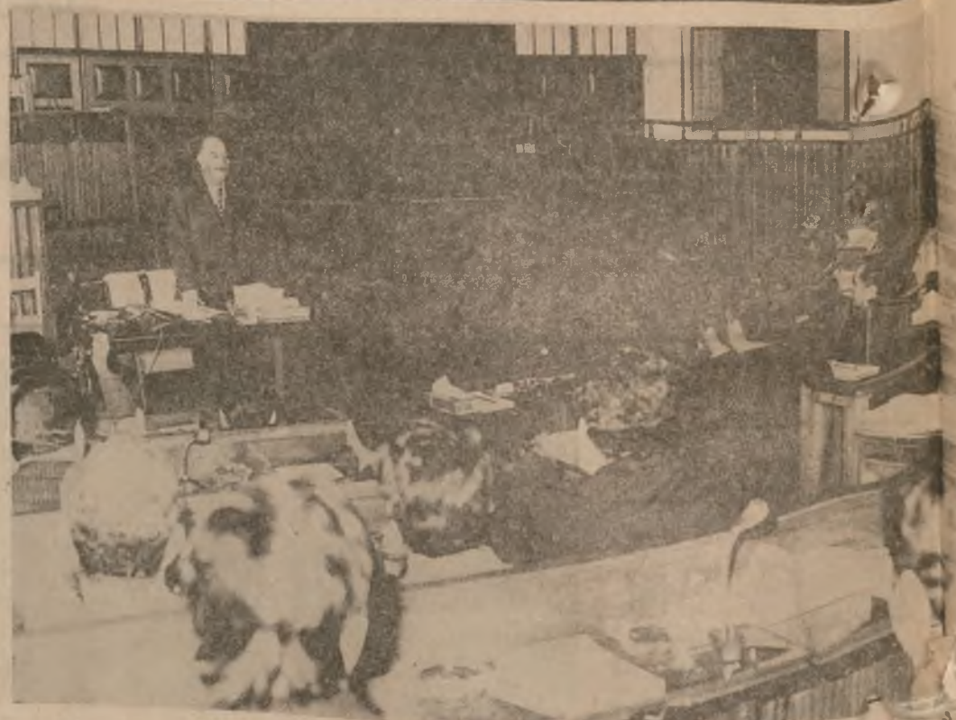
کاتیک باسی هه شته مین کونگره هه ریمایه تی حزبی به عسی سوشیالیستی عه رهب و نهو به لگه میژویه ده که مین که به ری خست ، پیویست ته هه مهو لایه نه کانی به لگه ی راپورتی سیاسی لیک به دینه وه که هه ر له کاتی به رچونیه وه به بهر نامه ی کاروشته مهو نۆه مه دما بئیره وه که مان له نیوان کونگره ی هه شته مهو نۆه مه دما بئیره وه .

به بۆته سېيه مين بیره ووری کونگره هه ریمایه تی هه شته می حزب وه :