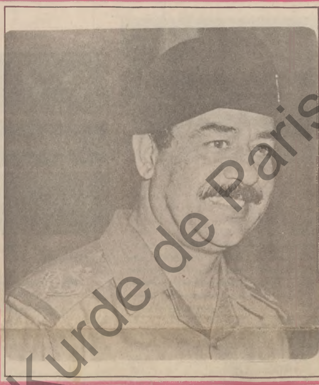
یانه وان کانی سووی عیراق خه روفی چاوه منوکی دورمین گوره ده که ن

نهمش دهقی و ته که سی به ریز سهره کی فرمانده یه دوروژ له موه بهر خومه یی و تاریکی هه بوو که سه رنجدا نهرکیزی کرد بووه دزی بهر بهر کانی کاری ئیران و دز به رۆژ که یان له ناو وه ده لین رۆژ که یان نیسلا می راسته قینه نیه ، خوژی ده لأم ده داته وه ده لئی رۆژ که کی نیجه نوینه ربه تی نیسلا می راسته قینه ده کاو نه وان واته بهر بهر کانی کارانی ئیران نوینه ربه تی نیسلا می راسته قینه ناخن ، نهو نه کهر خویندنه وه نووسینی بزایاییه ، پتیمان دهوت دوا ی خویندنه وه نووسین ، پتیمان نانی کاه یه نیسلا مه تی راسته قینه که ته نهو نمونه که مانه ی له ده یان به لکو سه دان نمونه باسیان ده که ین روویان شه رمه زار کردو له زیانی نهم دنیا بهر له نهو دنیا رووی رۆژ که کی نهمرۆ وه هتا هتا یه شه رمه زار کردو ، پسئی ده لیبسین هه لو یستی مرۆپایه تی عیراقیه کانت بیستوه نوینه رانی نیسلا می راسته قینه له و لاته مه زنده ، چون مامه له گهل دیله کانتان ده که نهم هه لو یستانه شایانی ریزو شانازی ده بن تک بیژ مرۆپایه تی له م سه رده مه دا به لکو میرو و توماری ده کات تا ماهه یه کی دورود ریز که نیشانه ی شه رمه زار نیشانه ی راسته ی له سهر نهو بیرو باوه ری که هه مانه .