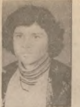
ژبان - بشکوشا - هه زانفان -