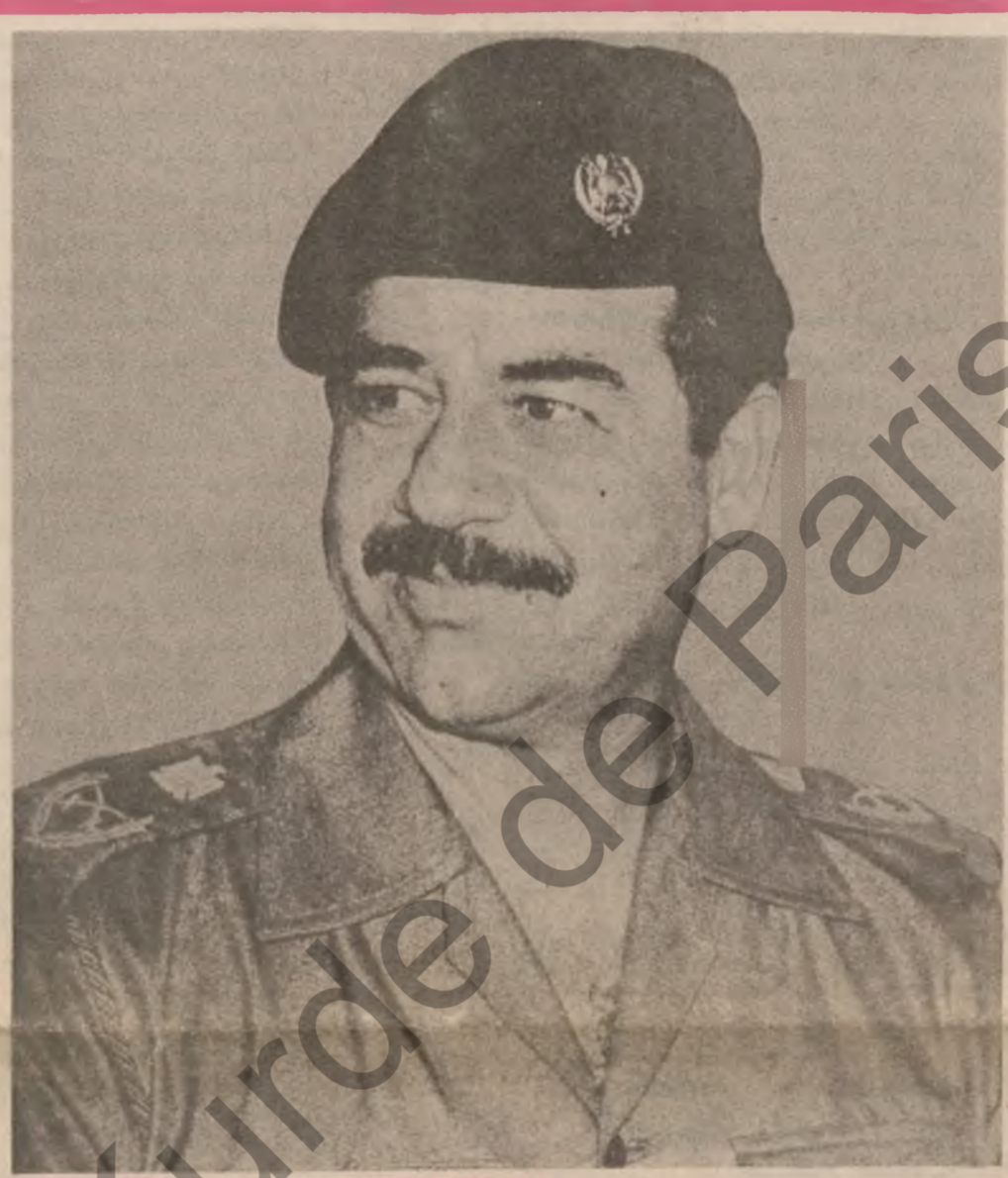
ئیراوی به ریز سه رهکی صدام حسین بۆ لای سه ره کی سه ره کی گه رگه قاهه

نهو هه و الانه ی له تاران وه گه شتون وا ده گه بن که رۆژی خومه بینی له دوایه دا ژماره یه کی زۆری پاسداره کانی له ناوچه ی کوردستان و ناژدیجیان له کوژراوه ، نهویش له نه نجای فراوان بوونی چالاکی هیزه به ره هه لستکاره کانی رۆیه له وه دوو ناوچه یه . له بهر نه م وه زعه سه ره کی رۆژ نه وه رۆژیم خاشنی له گه ل باریزه ری ناژدیجیان رۆژ ناوا کۆژ نه وه باسی چۆنه تی به گۆر دا چوون و به ره هه لستکاره کانی کردوه . رله یۆ تاران به زمانی فارسی ووتی گوایه باریزه ری ناژدیجیان سوپاسی خاشنی کردوه به وه ی بنکسه ی به ره به ستی به ره هه لستکارانه ی له کوردستان و ناژدیجیان سی رۆژ ناوا دا ناوه . پروانه ل : ۷