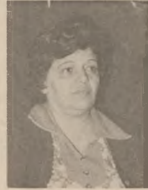
به کیتی خاتو (ادیبه) ده لقی :-

دهرباره ی چالاکي لینه کانی نارفه تانی نووسینگه ی ههولێر