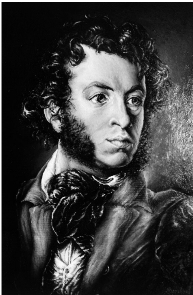
Александр Сергеевич Пушкин КАМЕННЫЙ ГОСТЬ