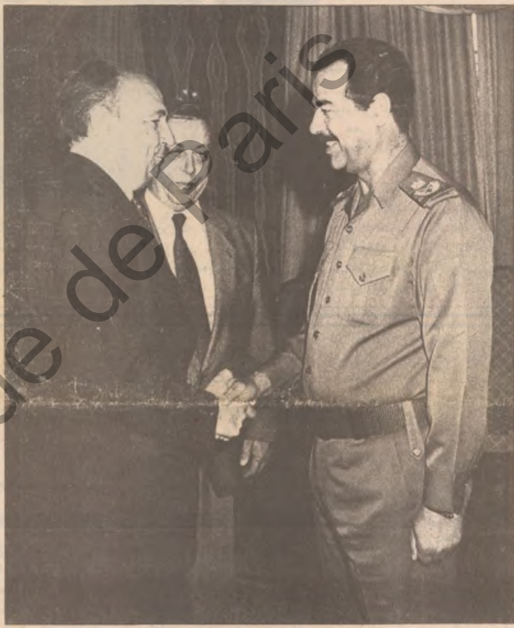
بهرزی سهره ک صدام حسین پیشوازی بهرزی فلا دیمیر پترۆفسکی چیگری و جزیری دهره وهی سو فییه تی گرد .

له پیشوازی به که دا بهرزی پترۆفسکی نامه کی ده می به بهرزی سهره ک صدام حسین له گور باسرفه وه بیگه باند .