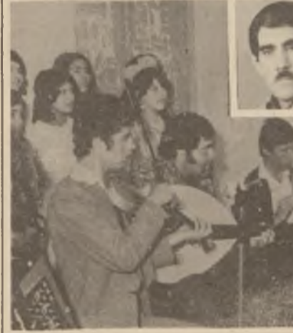
شاره دزېږنه كې كۆبسه گملي هونېر مېندو هونېر مېنډي ...

سازتې له گگل څخه هونېر مېند عبدالل چاوشیندا