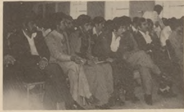
په هاوکاري له ههله بجه