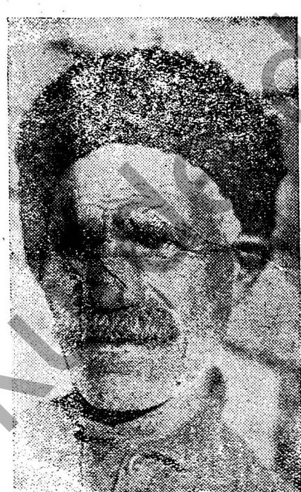
Kolhozvan hēv. Bvrgo