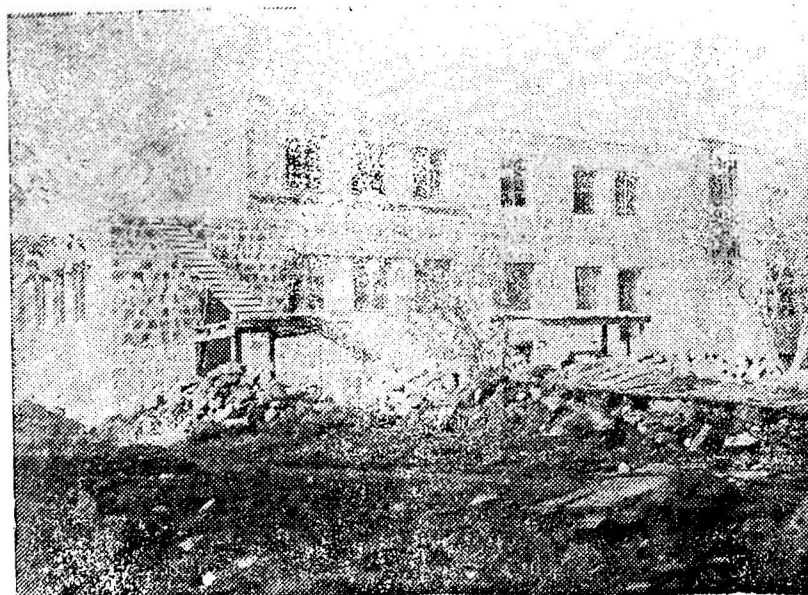
Avajə teknikuma kyrmança təzə zə para

Bəri inglaba sərja paşyn, wəxtə hykymətə padşə, ysa zı wəxtə daşnaka mılletə cək haləkli xrav dərbaş dəkəry alije xuyəndəne, kulturaje u zijine. Wəki əm bə-