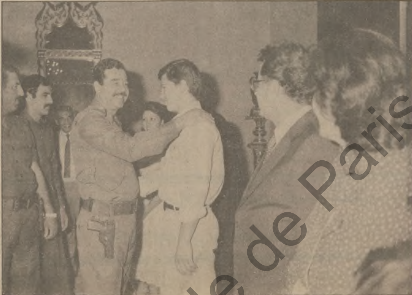
له روانین هه لسو که وتدا ، هه ربه هاو حاله که وایه له و کومه لانه دا ئالۆزی له به یه ونده بکه ن کومه لانه پیناندا هه یه .

شۆرش له روانینو هه لسو که وتدا هاوسه نگی دیارترین سیفته له سیفته کانی شۆرش تیموز ئه وه یه ، شۆرشیکی هاوسه نگی له روانینو هه لسو که وتدا ، با له سهر ئه مه نمونه پینینه وه . . شۆرشیکی تیموز شۆرشیکی سۆشالیته یه ، به لام ئایا له که سی وه رگرتوه ، شۆرشه سۆشالیته کان له جیپاندا له م چین بان له وه ده سته بان له و بان ، بان له م که سه بان له وه بان وه رده گرتی تا بیدات به که سانی تر ، به لام شۆرشیکی تیموز به هه مووانی داو له که سی وه رنه گرت تنیا توربانی دانی ئه رکه نه پین بۆ بهرگری له نیشتمان به خواستی خۆی بان به پنی باسکانی خزمهتی عمه کوری ئه مه ش مه سه له یه کی ره وابه له هه موو نانه کاندای هه مانه کانی ئه رزو ئاسمانداو دوژمنایه تی نیه له نیوان کورته کومه لانه پیناندا متضانه بکاته سهر ئه و زۆران باز یه ی که پیتوست به قه و له ناو بردن بکا به لکو لیره دا روانینی هاوسه نگی بۆ کومل هه یه وه کارکردنی نه خسه کیشراو تا کومل پیتیت کومه لیتی هاوسه نگی به توانا شوینان له چوارچویه گشتی سیسته ی