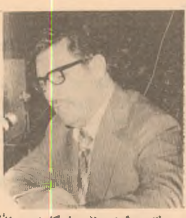
تير دراوی « هاوکاری »

● دواي نه وه ش هونرمهنان مامۆستا نامدار مهولوی راي خۆي ده رپه ري وتی . X خۆم به خه تيار نه زانم که دواي هه لپه يکي زۆر تو ايمان تيبی موسيقای مهولوی سه له نوي دایه رتيه مه وه هاوبه شي ميره جاني رۆژي که م ترخمي تيارا کريت و هه مووان به کوزي توانا و به پيري خۆ هيلاک کردنه وه رونان بۆ هونري کوردی .