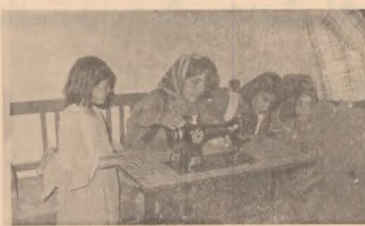
با به‌خاندان به‌ نه‌وه‌ی نوێی جوتیار