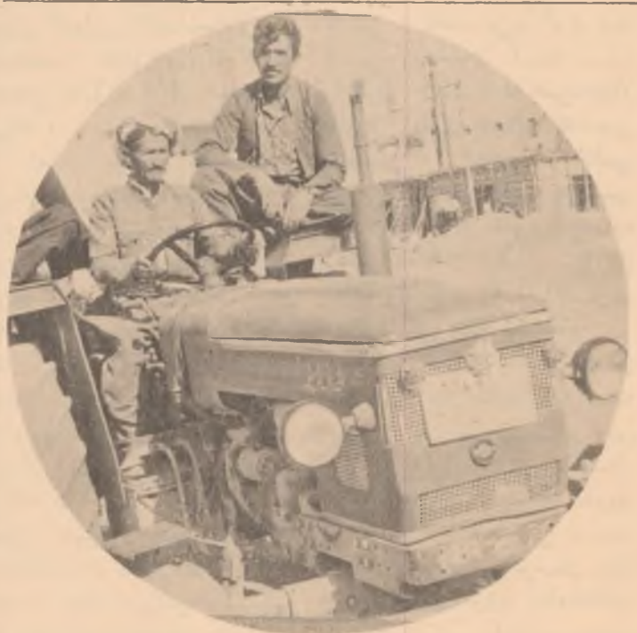
راهبانی جوتیاران !