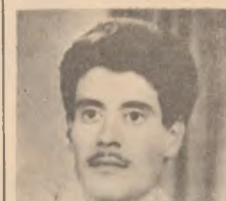
به بونهی تیره پونی جیل روزه بهسر خوا لری خوشبوی لای جوان محسن کاکاغا سلا احمد آغا القفوری

برای شیرینم کاکه محسن نیمبرو ۴۰ چل روزه تیره بهسر سفه ری په کجاریت بهدلیکی برهواوه له ته منی لای مال ناوایت کرد لیم جهانه ، له ما بهینی چپا کانی باوچی و هه به سلطان که کوزی خه مبارو دامو بوه مالی په کجاریت باو هوشی بژ تو کرده وه بهو بهری سهر بهرزه بهو پینجسوزی له کانی توش کرد . قبول کردی به میوانی به کجاریت هه شمی ریزلینا تیکی گوره به بژ تو . توی تامه زوری زبانی کامه رانی بژ کشت روله کانی نیشتمانی به هشت جیکه هه تاهه تاهه له توله زبانی برنمشکه نهجو نازارت . خونچی جوانی گول کاکي محسن بوو گول خونچی ساوا سهری کرده وه نه مسه فهری کرد کوچی دوابی بوو کاکسی خوشه ویست بژ دوورده کوتیه و ته منی لایوت بوی واکورت بسوو به پای نهجلو گهرده ولو تمه . . . . . همل ورینی تو پیش هموو گول بوو گولی داموی له دار کرده وه کاکه هژاکه کاکه می به به ستم چنده بیوت نه کم نا که مه هه ستم خه یالم نهروا قهت باورناکم . . . . . که تو کجرت کرد رژی لده ستم برات قباد کاکاغا ملا احمد آغا القفوری له شاری کویه