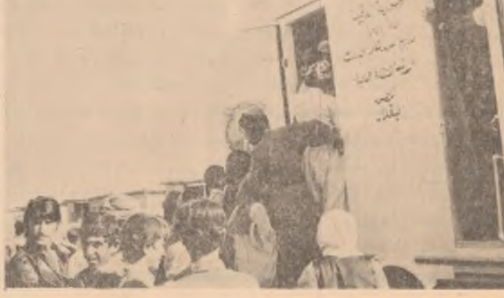
به‌ ته‌نگه‌وه‌هاتی بساری ته‌ندروستی جوتیاران

کراوه‌یه‌وه ، دیسان ده‌رباره‌ی که‌ به‌باندنی مندا لانی لادی جوار ده‌ره‌مان کردۆته‌وه که ۱۳۴ سه‌لال له مه‌له‌نه‌کاندا به‌شداریه‌یان کردوه . لایه‌کی تری کاروو باری به‌رئوه‌یه‌ی شوڤرشکارانه‌ی را به‌ری جوتیاران به‌سه‌په‌ری که‌ژوه بۆ جوتیاران له‌ ماوه‌یه‌دا ۱۱۷ کۆری ئاراسته‌په‌ری فران کردنی شاره‌زایی جوتیاران بۆ چاڵدن به‌هه‌م هه‌تانه ساز کراوه ، بێگه‌هه‌شتی قه‌لیبی سه‌نه‌ما‌ی نایسته‌تا ۲۱۱ کۆری پێشاندانی قه‌لیب ساز کراوه ، هه‌روه‌ها به‌خاندان مه‌له‌ندی را به‌ری کردنی ژنی لادی عه‌ن نایسته‌تا ۲۲ مه‌له‌ندی به‌و چه‌ره‌مان کردۆته‌وه ، نه‌وه‌ی شایانی باش ، هه‌ندی جار ده‌وره بۆ جوتیاران له‌ناو شه‌ساردا ده‌گه‌رتوه‌وه نه‌و جوتیاره‌ی له‌لایه‌وه ده‌شته شاره‌زایی به‌شداربوون له‌م چه‌ساکۆره ده‌ره‌انه‌دا موخه‌سه‌لات و شوێنی نووستن و خوارنیه‌یان بۆ زامان ده‌گه‌رت ، له‌ یه‌رۆه‌کانی دا هه‌تانه‌دا ، به‌رئوه‌یه‌یه‌ی ناو برا و نیازی وایه‌ ( ۷ ) مه‌له‌ندی تر ده‌گه‌رتیه‌وه ، له‌گه‌ل ( ۱۹ ) مه‌له‌نه‌ندی په‌گه‌باندنی و گوێش کردنی مندا لانی لادنه‌دا . به‌رئوه‌یه‌یه‌ی شوڤرشکارانه‌ی را به‌ری کردنی جوتیاران نایسته‌تا ( ۱۹ ) مه‌له‌ندی شوڤرشکارانه‌ی جوتیاران له‌ لادی کانه‌دا کردۆته‌وه که برینیه‌ی به‌سه مالی راهبانی و به‌شداربوون